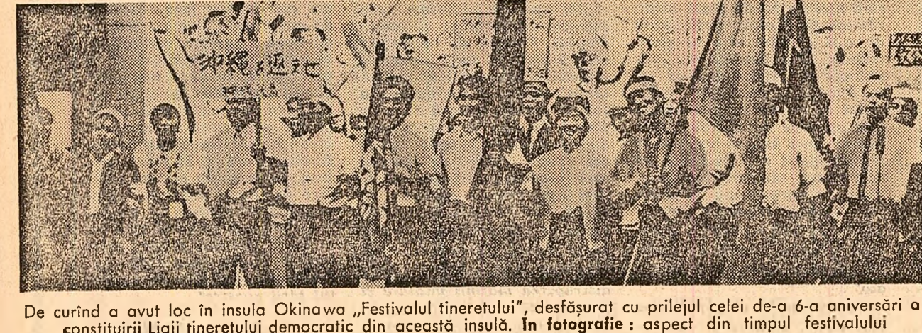
De curînd a avut loc în insula Okinawa „Festivalul tineretului”, desfășurat cu prilejul celei de-a 6-a aniversări a constituirii Ligii tineretului democratic din această insulă. În fotografie: aspect din timpul festivalului