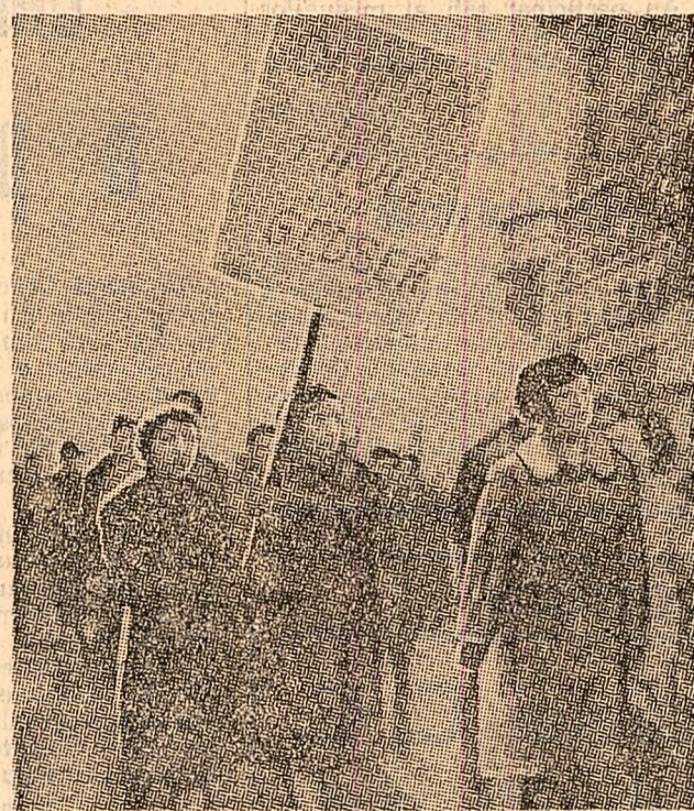
COPENHAGA. Locuitorii ai Groenlandei demonstrează împotriva prezenței bazelor militare americane pe insula lor

*) Autorul este corespondent al agenției France Presse la Saigon.