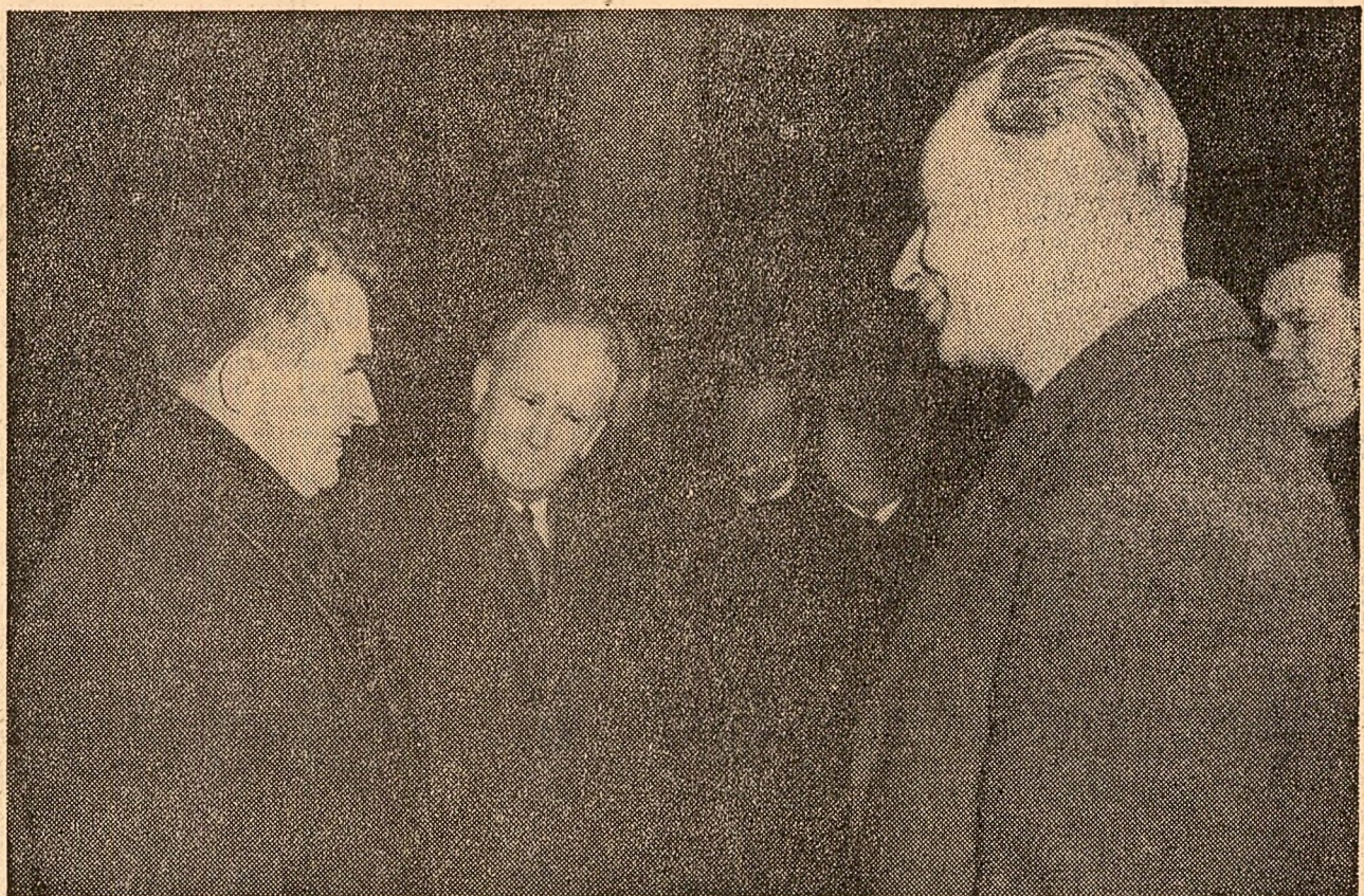
La gara centrală din Praga