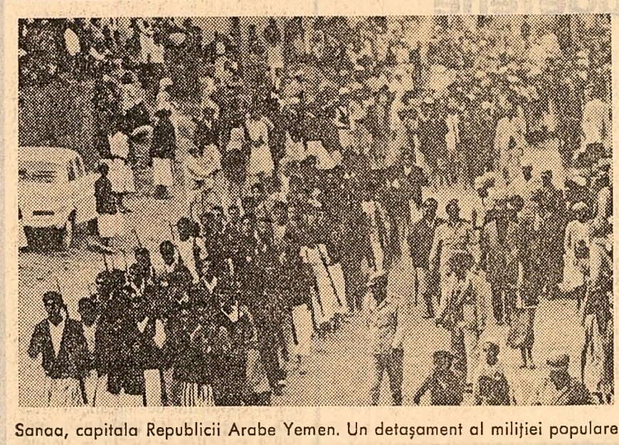
Sanaa, capitala Republicii Arabe Yemen. Un detașament al miliției populare

După cum se vede, motive de neliniște întemeiate. G. DASCALU