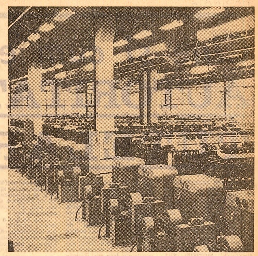
„Industria lînii” Timișoara. Ca urmare a investițiilor făcute s-a dublat producția filaturii de lînă pieptănată. În fotografie: secția nouă de ringuri a filaturii