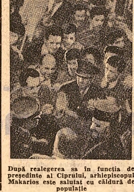
După re alegerea sa în funcția de președinte al Ciprului, arhiepiscopul Makarios este salutată cu căldură de populație.

La deschiderea festivă a tîrgului a participat și o delegație guvernamentală română condusă de Mihai Marinescu, ministrul industriei construcțiilor de mașini.