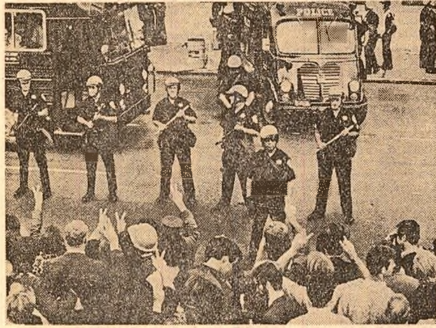
OAKLAND. Tineri americani demonstrează în fața principalului centru de recrutare din oraș împotriva războiului dus de S.U.A. în Vietnam

tele cu mortiere și artilerie. Pentru a treia zi consecutiv bazele trupelor americane din zona platourilor înalte, printre care Kon Tum, regiunile din centru și mai ales zona din delta fluviului Mekong au fost bombardate de H-1 mieterelor forțelor patriotice. Șapte baze americane din nord-vestul Saigonului au fost, de asemenea, bombardate. Chiar în imediata apropiere a bazei americane de la Con Thien și Dong Ha, au fost atacate bazele americane de la Khe Sanh, unde se află încreșteri 6000 de militari americani, au continuat bombardamen-