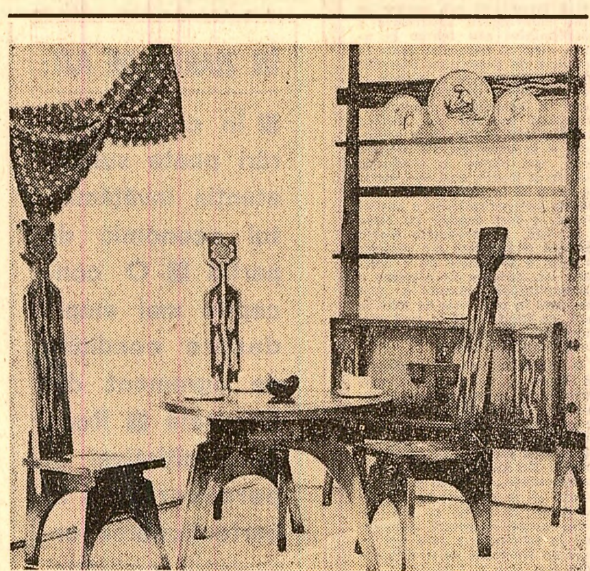
La magazinul „Căminul” din Capitală au fost expuse cîteva tipuri de mobilă de inspirație populară. Iată, în fotografie, modelul „Bucium”

Continuînd o străveche și generoasă tradiție a primăverii și a sentimentului, ne amintim în aceste zile de gestul delicat de a oferi un dar, un cadou femeii îndrăgite, fie mamă, soție, soră, bunică, prietenă. „DECADA CADOURILOR PENTRU FEMEI” (28 februarie — 8 martie) este și un „examen” pentru bărbați. Vor reuși oare toți bărbații la acest examen, oferind femeii iubite cadoul preferat?