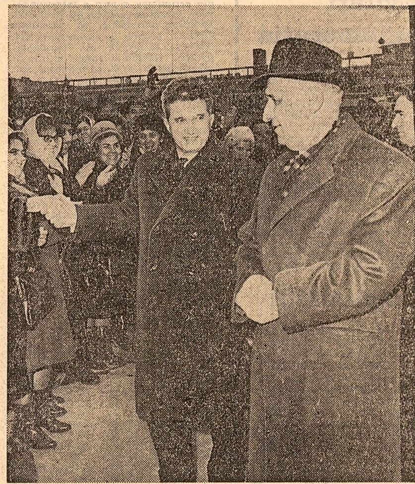
La sosirea pe aeroportul din Sofia