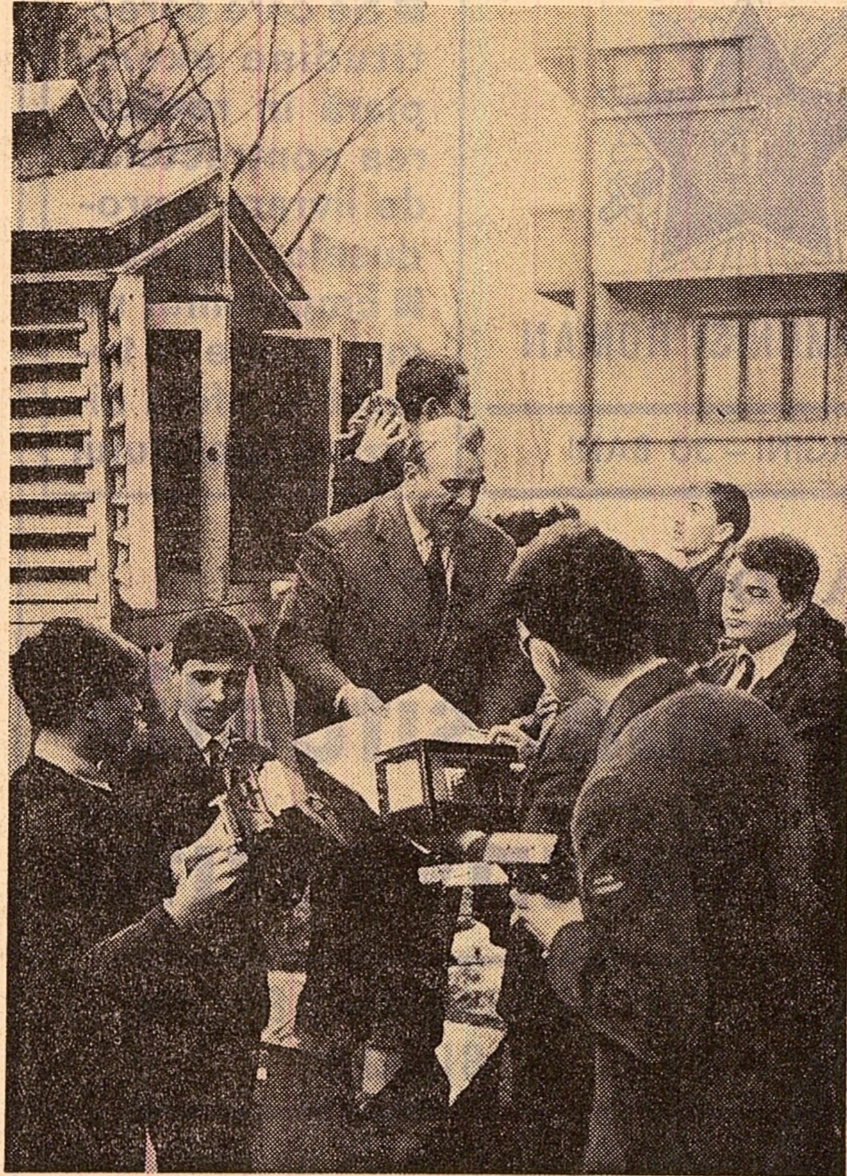
Lección practică de meteorologie.