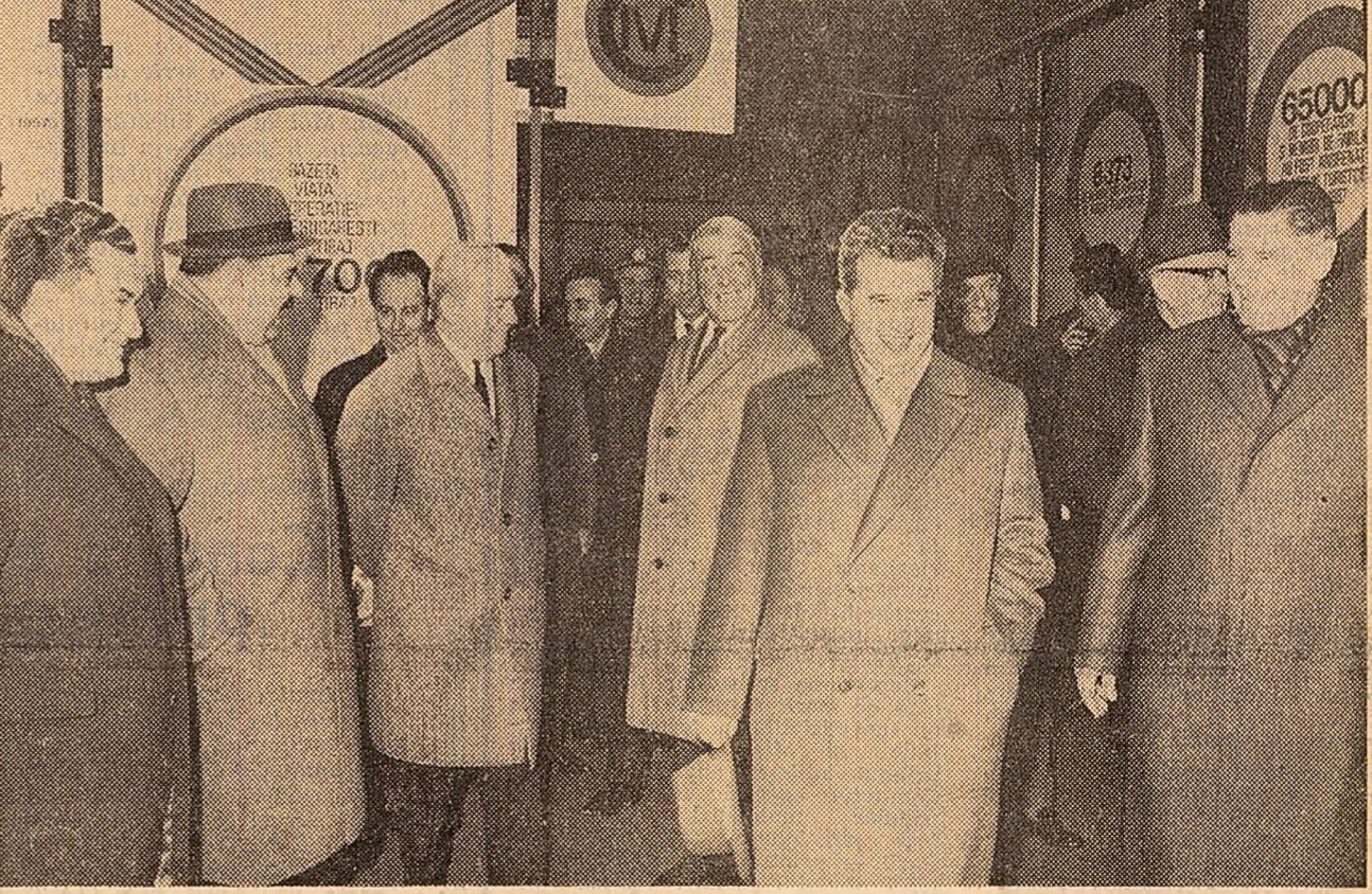
Conducătorii de partid și de stat la unul din standurile expoziției