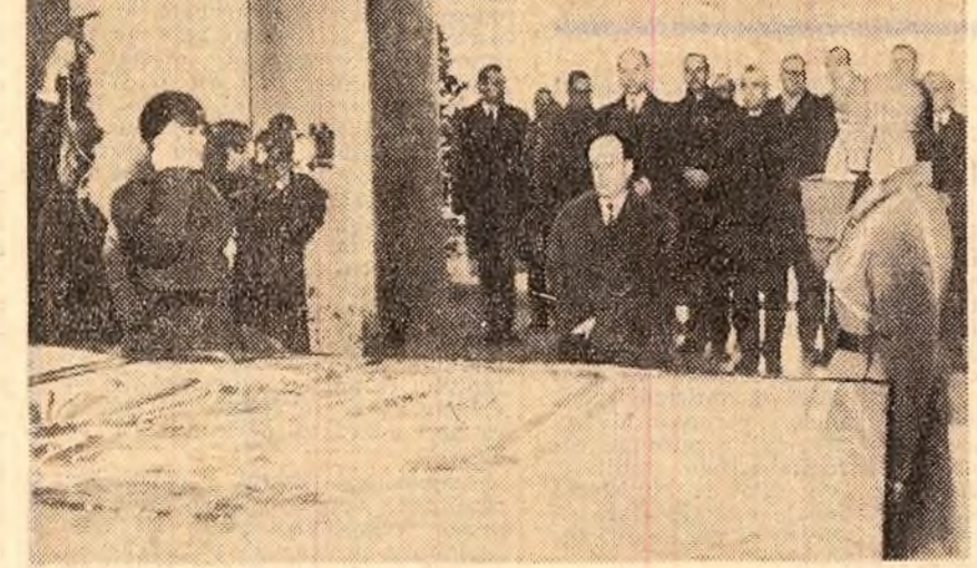
Cu prilejul împlinirii o 30 de ani de la cucerirea Austriei de către hitleriștii, la Viena au avut loc odonări comemorative. În fotografie: cancelarul Austriei, Josef Klaus, depeunnd o coroană de flori la mormîntul eroilor luptei de rezistență

Premierul indian a amintit că țara sa a făcut cunoscut clar că nu consideră pe deplin satisfăcător proiectul actual al tratatului de nedesemnare. Ea a menționat, totuși, că poziția indiană nu este „rigidă” și dacă textul proiectului va fi modificat într-un fel care să satisfacă interesele Indiei, guvernul său va putea fi în măsură să semneze documentul.