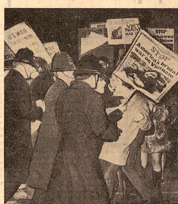
R. D. VIETNAM

Convorbirile Indira Gandhi — Otto Winzer. Primul ministru al Indiei, Indira Gandhi, a primit pe ministrul afacerilor externe al R.D. Germane, Otto Winzer, care se află în vizită în capitala Indiei. În cursul convorbirilor avute cu acest prilej, a fost făcut un schimb de păreri cu privire la situația din Vietnam și au