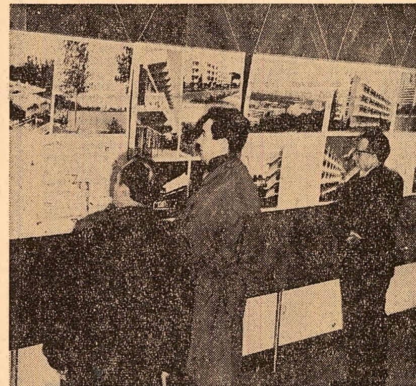
La Casa arhitectului din Capitală s-a deschis ieri expoziția „Premiile anuale ale Uniunii arhitecților pe anul 1967”. În fotografie: Un aspect din expoziție