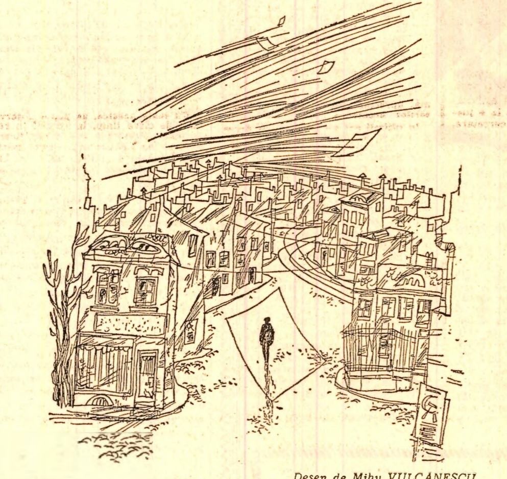
Desen de Mihai VULCANESCU