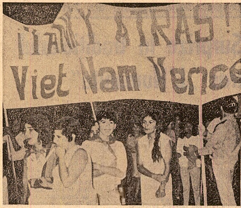
Tineretul din Santiago de Chile a condamnat, în cadrul unei recente demonstrații, războiul dus de Statele Unite în Vietnam