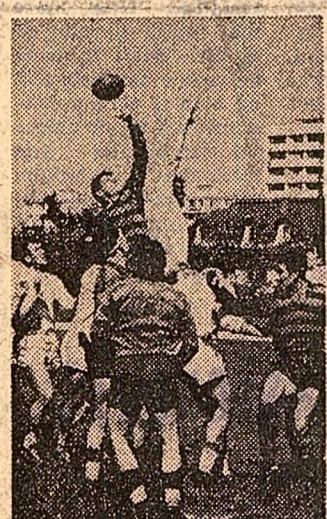
Duel între „urși” în meciul de rîgbi „Grivița roșie” Steaua

TENIS DE MASĂ Campionii naționali pe 1968