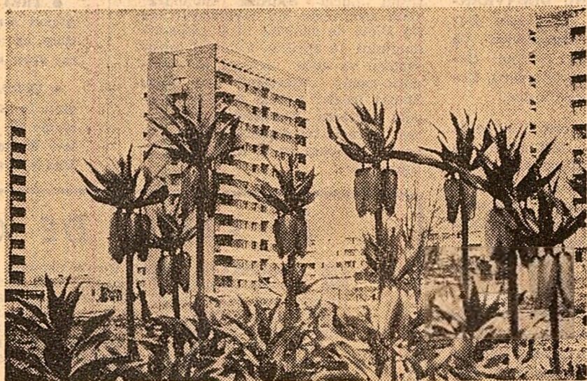
CRAIOVA. Calea Severinului văzută din Grădina botanică.