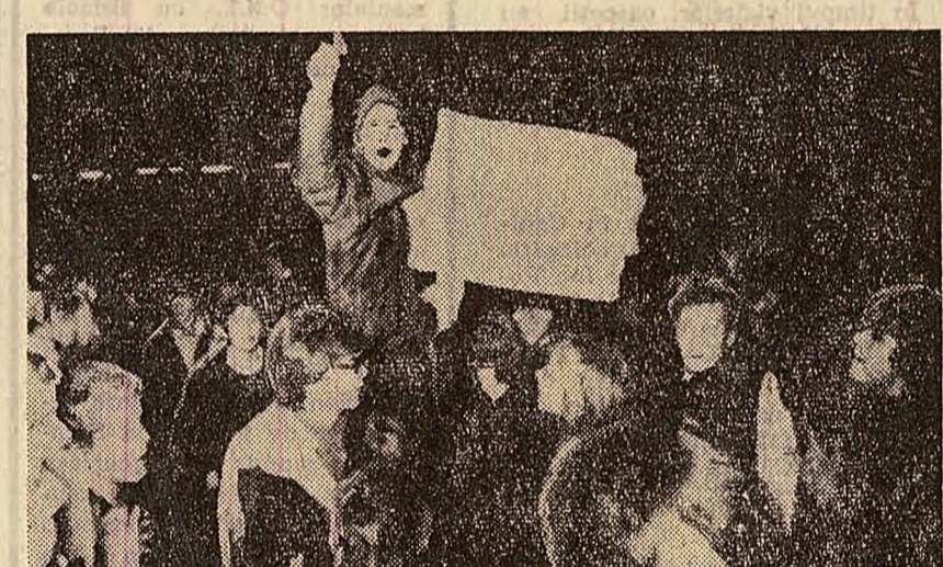
La Oslo a avut loc recent o demonstrație la care participanții au cerut ieșirea Norvegiei din N.A.T.O.

Buletinul Uniunii Internaționale a organizațiilor de turism (I.U.O.T.O.) semnalează o intensificare a turismului internațional în anul 1967. Potrivit datelor publicate, înscărierile realizate de pe urma turismului internațional au sporit anul trecut cu 8 la sută față de anul 1966, cifrindu-se la aproximativ 1 miliard de dolari.