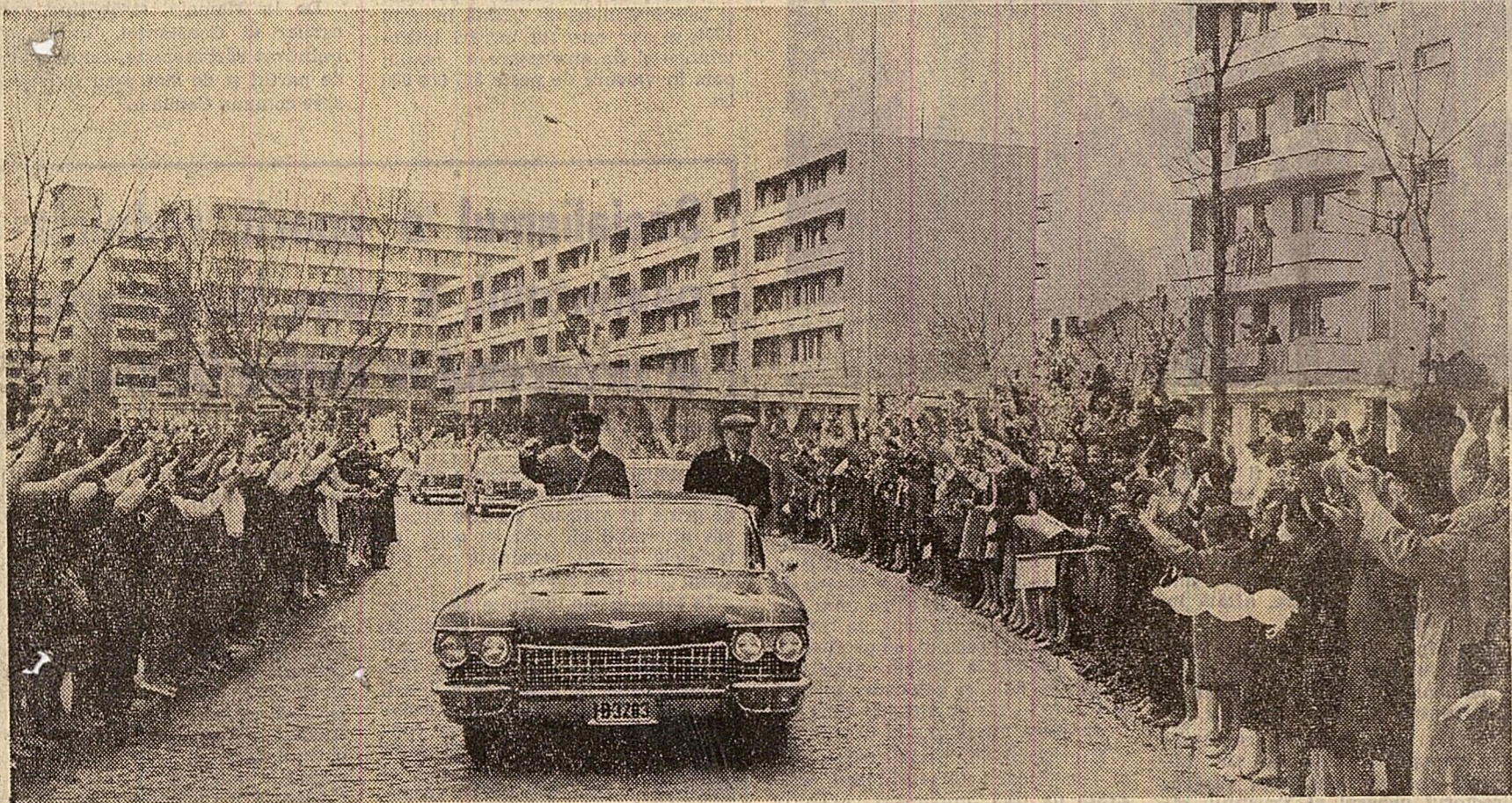
Cetățenii din Constanța întâmpină cu căldură pe conducătorii de partid și de stat

președintele Consiliului de Stat al Republicii Socialiste România