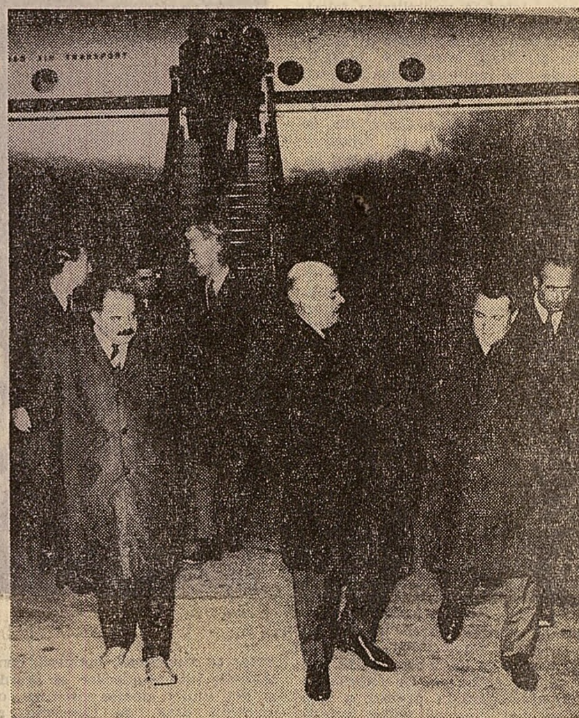
La sosire, pe aeroportul Băneasa.

STOCKHOLM 11. — De la trimiterea specială Dumitru Tinu și Vasile Chișu: Joi după-amiază, președintele Consiliului de Miniștri al Republicii Socialiste România, Ion Gheorghe Maurer, însoțit de ministrul afacerilor externe, Corneliu Mănescu, a părăsit Stockholm, îndreptîndu-se spre patrie, după o vizită oficială de patru zile, făcută la invitația guvernului suedez.