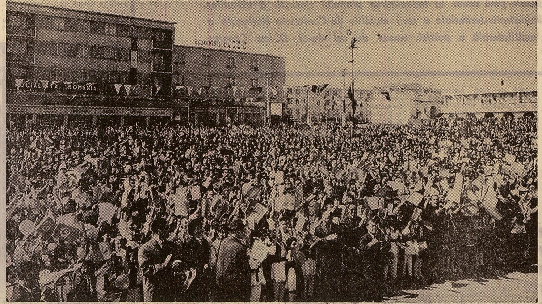
La mitingul din oraşul Medgidia

De la Mamaia, străbîntînd III, îmbrăcat sărbătoros, conducătorii de partid şi de stat s-au îndreptat spre comuna Comana.