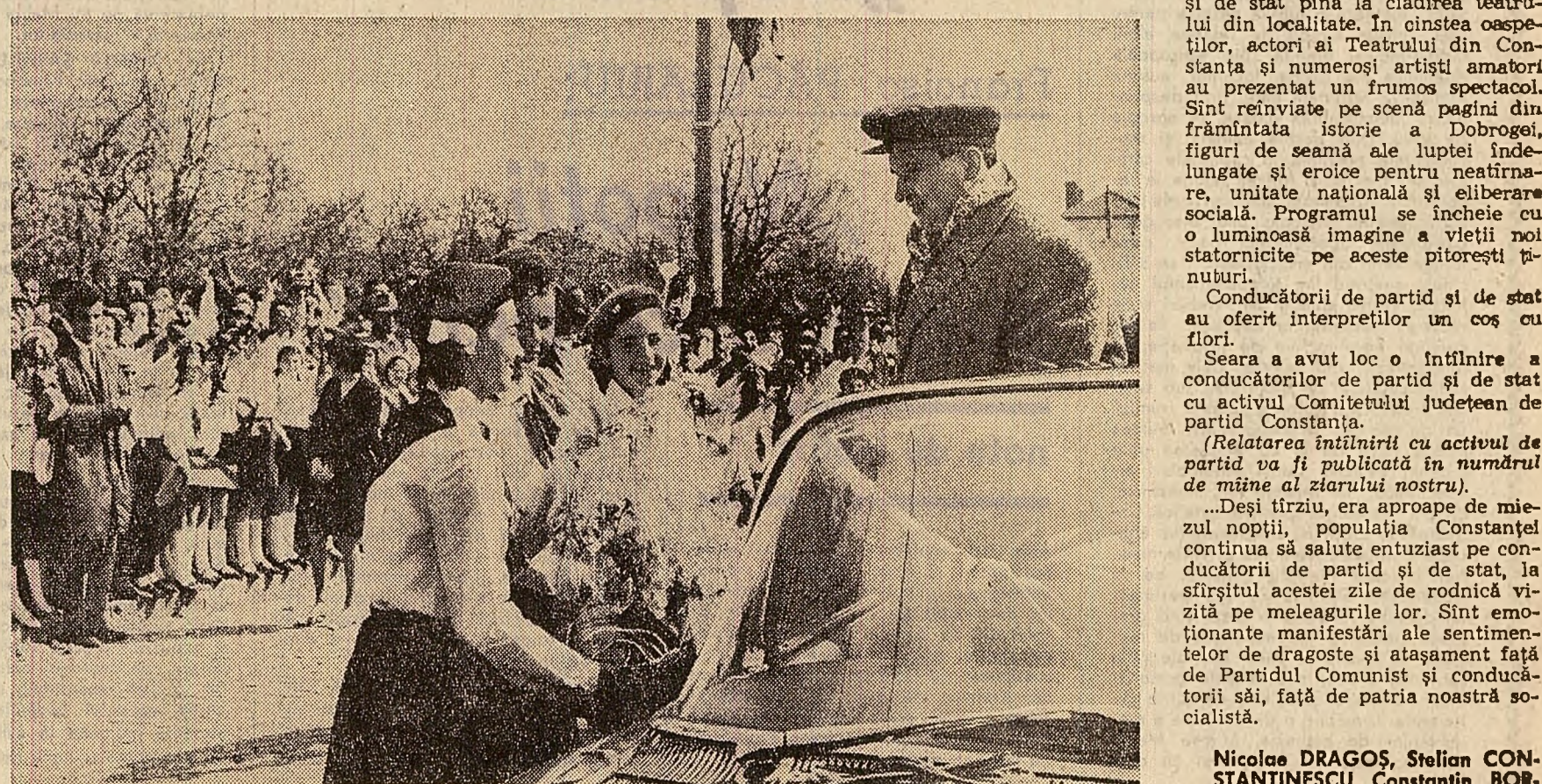
Prin activitatea sa, partidul nostru pornește de la necesitatea ca cele mai importante hotărîri și măsuri...