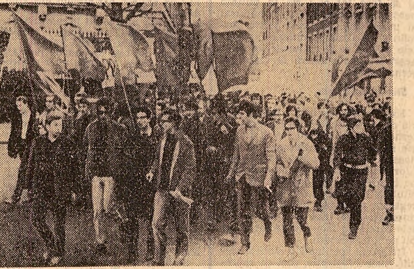
În Berlinul occidental au continuat demonstrațiile studențești în semn de protest împotriva tentativei de asasinare a liderului Federației studenților socialiști, Rudi Dutschke (fotografia din stînga). Manifestații de solidaritate cu studenții vest-berlinezi au avut loc în numeroase orașe occidentale. Aspect de la demonstrația din Paris, (fotografia din dreapta)