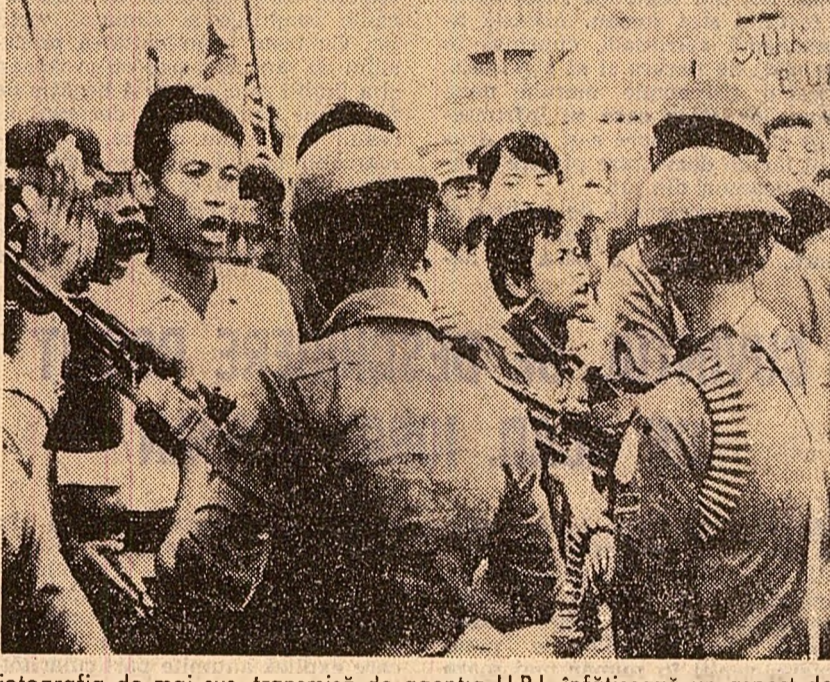
Fotografia de mai sus, transmisă de agenția U.P.I. înfățișează un aspect de la o demonstrație antigvernamentală a studenților din Djakarta

Primul ministru al Somaliei, Ibrahim Egal, care a efectuat vizite oficiale în S.U.A., R. F. a Germaniei și Marea Britanie, a sosit luni la Roma. În capitala Italiei, premierul somalez va rămîne cîteva zile, după care se va întoarce la Mogadiscio.