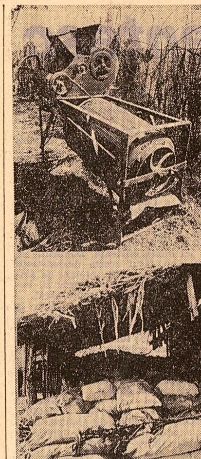
Cele două fotografii arată că la cooperativa agricolă din Adina, județul Dimbovița, consiliul de conducere dă dovadă de mult dezinteres față de avutul obștei. 1) Un tractor stă pîrșit lângă un gard. 2) Îngrășămintele chimice depozitate fără pic de grijă s-au pietrificat din cauza umezelii. Cine suportă aceste pagube? Au un cuvînt de spus cei aleși să conducă această cooperativă