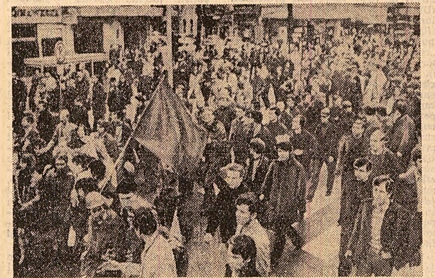
În Berlinul occidental au continuat demonstrațiile studențești în semn de protest împotriva tentativei de asasinare a liderului Federației studenților socialiști, Rudi Dutschke (fotografia din stînga). Manifestații de solidaritate cu studenții vest-berlinezi au avut loc în numeroase orașe occidentale. Aspect de la demonstrația din Paris, (fotografia din dreapta)