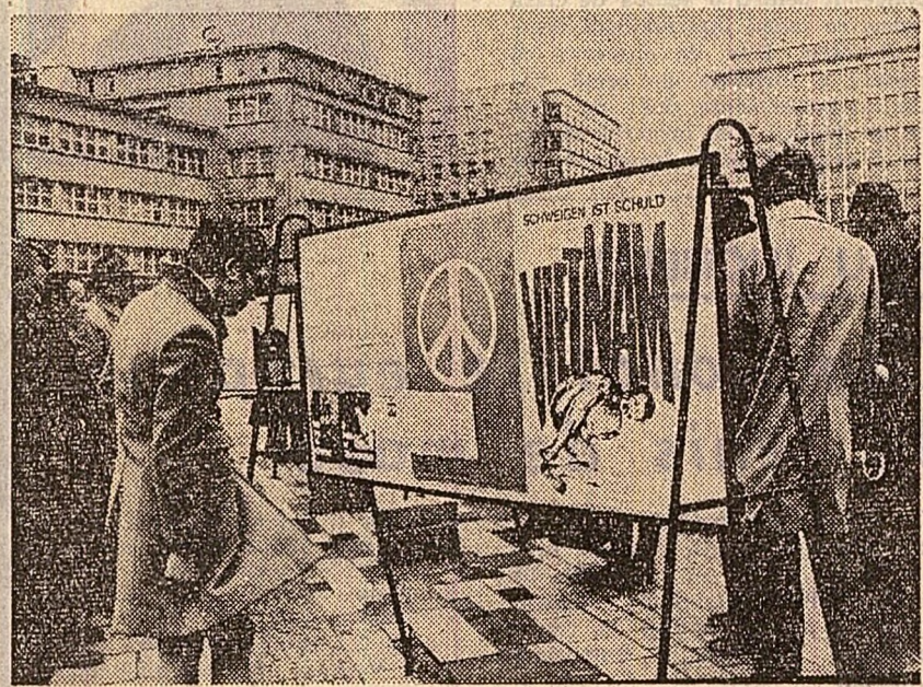
R.F.G.: locuitorii centrului industrial Essen protestează împotriva războiului dus de S.U.A. în Vietnam, expunînd pe străzile orașului panouri prin care cer să se pună capăt agresiunii americane

Seara, în drum spre Paris, membrii delegației române au vizitat catedrala de la Rouen, capitala Normandiei, important monument de arhitectură din secolul al XIII-lea, expresie vie a ingeniozității și a puternicului spirit creator al poporului francez.