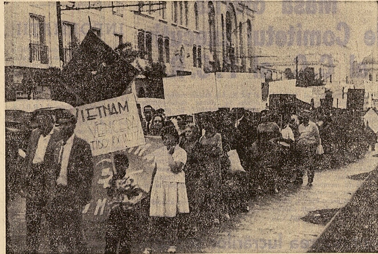
În ultimele săptămîni, în Chile s-au intensificat acțiunile de solidaritate cu lupta poporului vietnamez împotriva agresiunii americane. Pe străzile orașului Santiago a avut loc o impresionantă manifestație ai cărei participanți purtau lozinci ca: „Poporul chilian este cu Vietnamul!”, „Vietnamul va învinge pe agresori”. Membrii Camerei Deputaților au trimis telegrame președintelui celor două Camere ale Congresului S.U.A. în care cheamă forul legislativ american să acționeze în direcția încetării războiului din Vietnam.

Comandantul jandarmeriei naționale algeriene, colonelul Ahmed Bencherif, a anunțat ieri dimineața că cei care au încercat să-l asineze pe președintele Boumediene „nu mai sînt în viață”. Bencherif a vorbit în fața unei mulțimi de aproximativ 1.000 persoane adunate în fața Ministerului Apărării Naționale pentru a-și exprima protestul față de atentatul împotriva lui Boumediene.