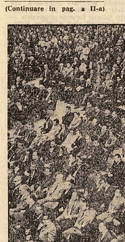
În timpul adunării activului de partid al Capitalei

cepției materialist-dialectice despre lume și viață, a înaltelor valori morale ale societății noastre, a pasiunii pentru muncă, a dragostei pentru patria socialistă și a încrederii neștrămutate în viitorul luminos spre care ne conduce cu înțelepciune partidul. Adunarea noastră își însușește în întregime aprecierile și măsurile adoptate de plenera C.C. al P.C.R. privind compoziția partidului, întărirea continuă a rîndurilor sale și intensificarea activității de educare a comunistilor, trăgînd concluziile ce se impun pentru organizația de partid a Capitalei. Împărtășim pe deplin aprecierile plenerii C.C. cu privire la pregătirea de luptă și politică a forțelor