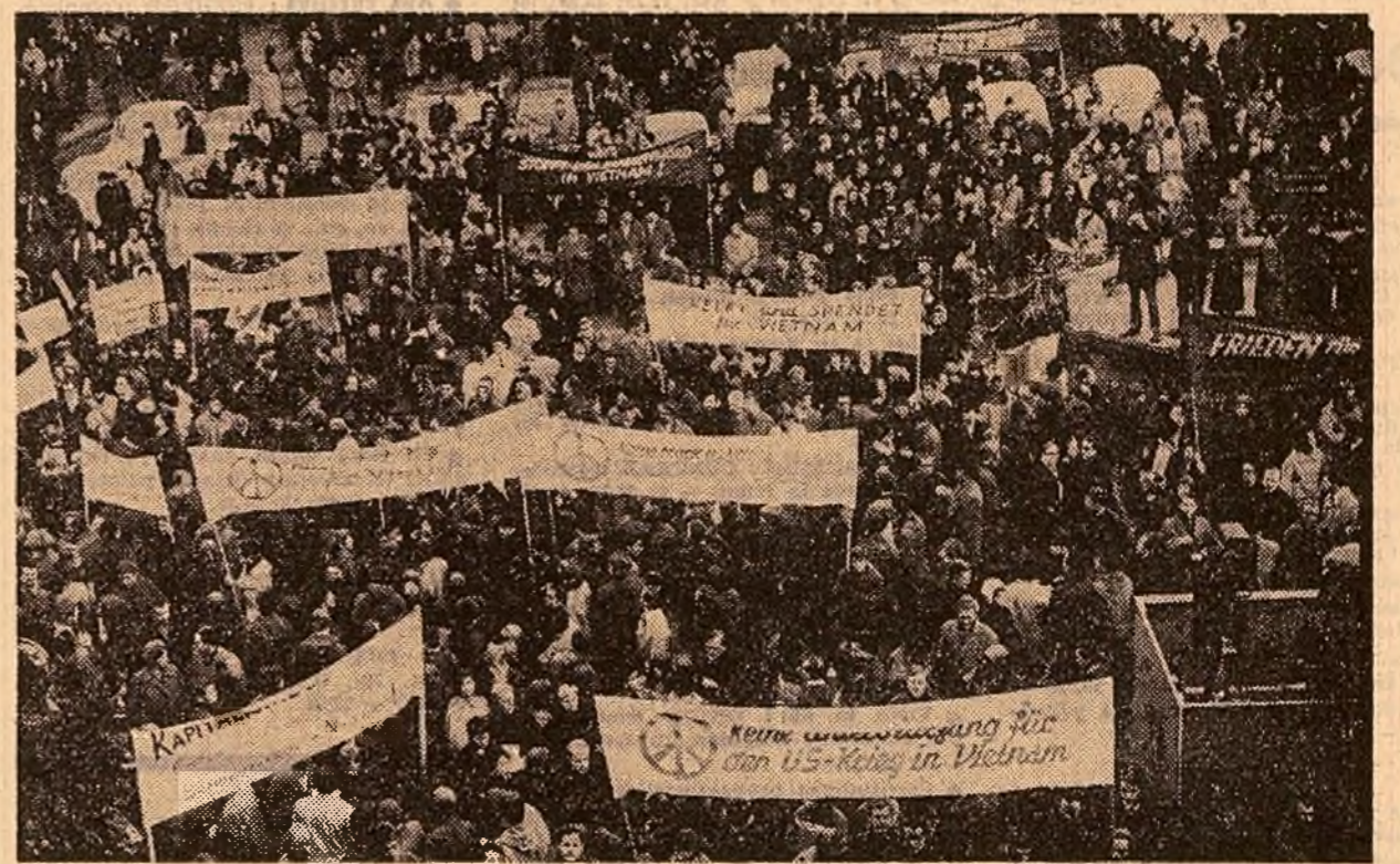
O cerere unanimă la împănătorul miting desfășurat la Frankfurt pe Main (R.F.G.): „S.U.A. să pună capăt agresiunii în Vietnam!”