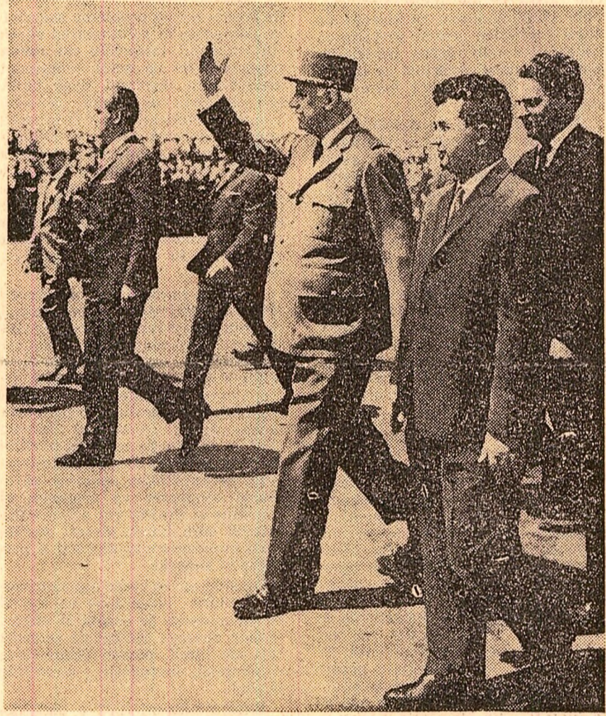
La sosirea pe aeroportul Băneasa

ASTĂZI, ÎN JURUL OREI 11.20, STAȚIILE NOASTRE DE RADIO ȘI TELE-VIZIUNE VOR TRANSMITE LUCRARILE SESIUNII MARI ADUNĂRI NAȚIONALE, ÎN CADRUL CĂRORA VA LUA CUVÎNTUL PREȘEDINTELUI REPUBLICII FRANCEZE, GENERALUL CHARLES DE GAULLE.