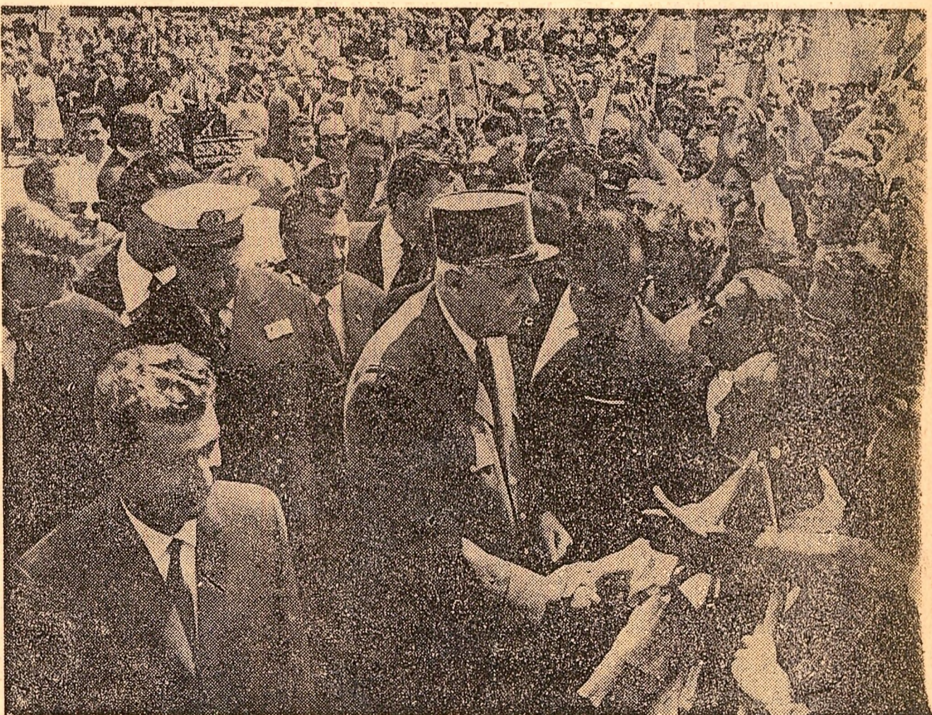
În mijlocul mulțimii, cei doi președinți răspund cuvintelor calde de salut