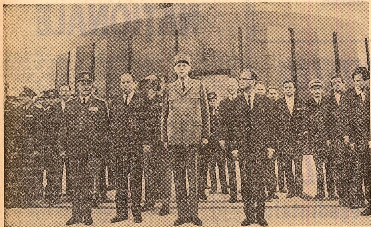
Pe platoul din fața Monumentului eroilor luptei pentru libertatea poporului și a patriei, pentru socialism