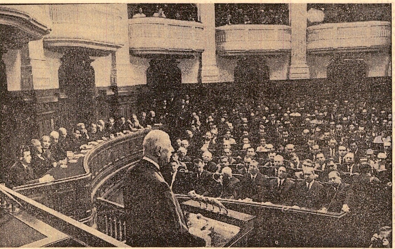
La Marea Adunare Națională

JOI, ÎN JURUL OREI 16.50, STAȚIILE NOASTRE DE RADIO ȘI TELEVIȚIUNE VOR TRANSMITE, ÎN DIRECT, DIN CRAIOVA ADUNAREA POPULARĂ ORGANIZATĂ CU PRILEJUL VIZITEI ÎN ACEST ORAȘ A PREȘEDINTELUI REPUBLICII FRANCEZE, GENERALUL CHARLES DE GAULLE.