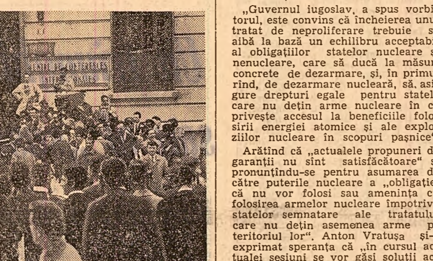
Reprezentanți ai presei in fața Centrului de conferințe internaționale unde se desfășoară convorbirile dintre reprezentanții R. D. Vietnam și ai S.U.A.

„S.U.A. și nimeni altul, a subliniat vorbitorul, sînt cele care au încălcat statutul zonei demilitarizate. Deci ele trebuie să înceteze bombardamentele contra acestei zone și să-și retragă toate trupele satelite din partea de sud a zonei demilitarizate. Primul lucru pe care S.U.A. trebuie să-l facă pentru a se ajunge la o soluție pașnică in Vietnam, a continuat el, este încetarea definitivă și fără condiții a bombardamentelor și a celorlalte acte de război împotriva R. D. Vietnam”.