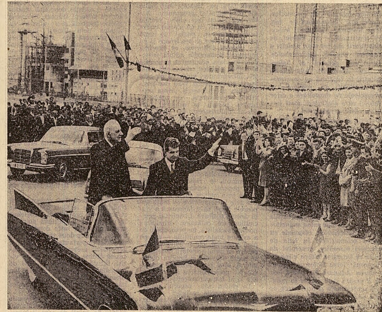
—și la Combinatul chimic

În continuare a fost vizitat Parcul poporului din localitate. După o plimbare pe aleile umbrite de arbori seculari, pe marginea lacului peste care se arcuiește un grațios pod suspendat, vizitatoarele s-au oprit la debarcadere. Aici, Radu Romanescu, fiul fostului primar al Craiovei, care la începutul acestui secol a amenajat parcul după proiectul arhitectului peisagist francez E. Redont, a prezentat istoricul și arhitectura acestui înclîntător loc de odihnă și recreație. (Agerpres)