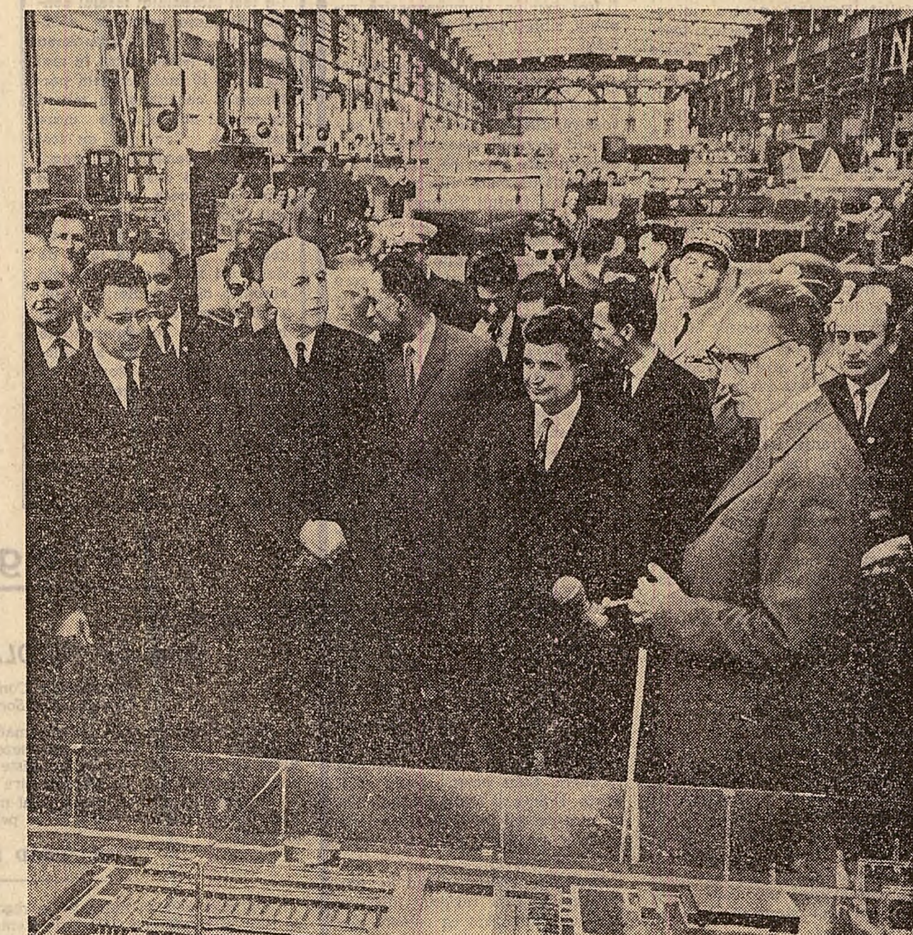
În vizită la Uzinele „Electroputer”

Ne pronunțăm cu perseverență și energie pentru lichidarea tuturor formelor de aspirare colonială, de dominație a unui stat asupra altuia, de presiuni și ingerințe în treburile altor țări, de spoliere a bogățiilor naționale, a rodului muncii altor popoare, pentru respectarea strictă a independenței și suveranității naționale, a egalității în drepturi între toate statele și națiunile lumii.