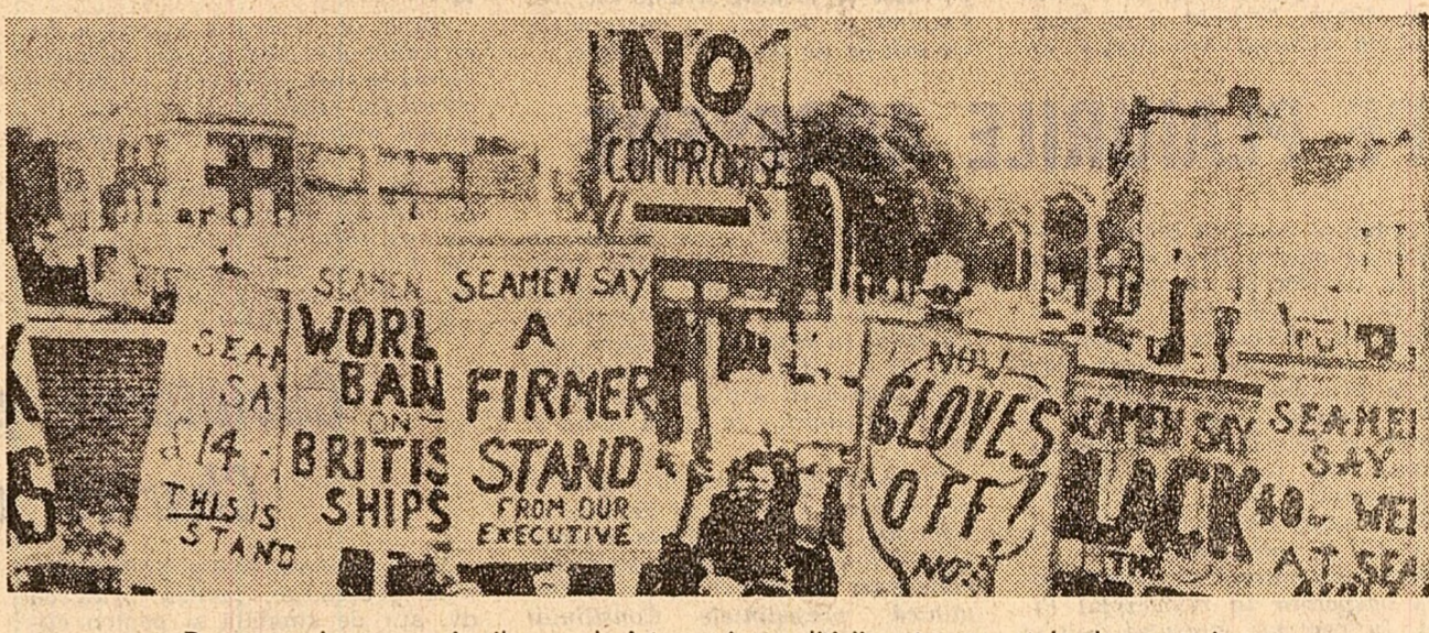
Demonstrație a muncitorilor englezi împotriva poliției guvernamentale de austeritate

„Autoritățile yemenite au încercat să evite o văr-