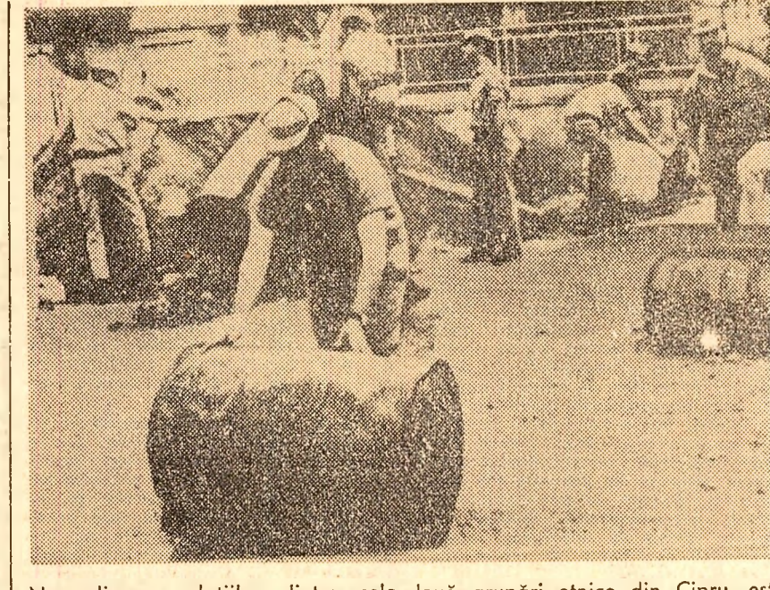
Normalizarea relațiilor dintre cele două grupuri etnice din Cipru este demonstrată și de această fotografie: ciprioti înlăturînd o baricadă ridicată în zona turcă a Nicosiei