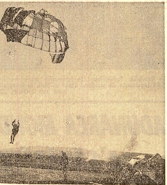
Oră practică de parașutism la aeroclubul din Tg. Mureș

Tragerea de amortizare pe luna mai 1968, a asigurărilor mixte de viață, are loc la 31 mai, în orașul Ploiești.