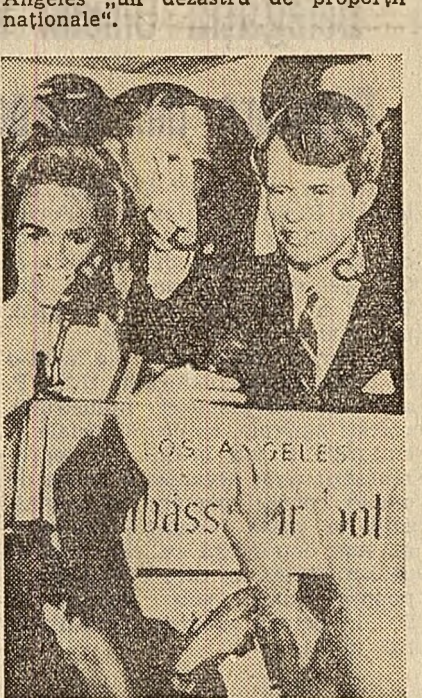
La tribună, Robert Kennedy își cheie ultimul discurs, însoțindu-l cu poporul semn „victorie”