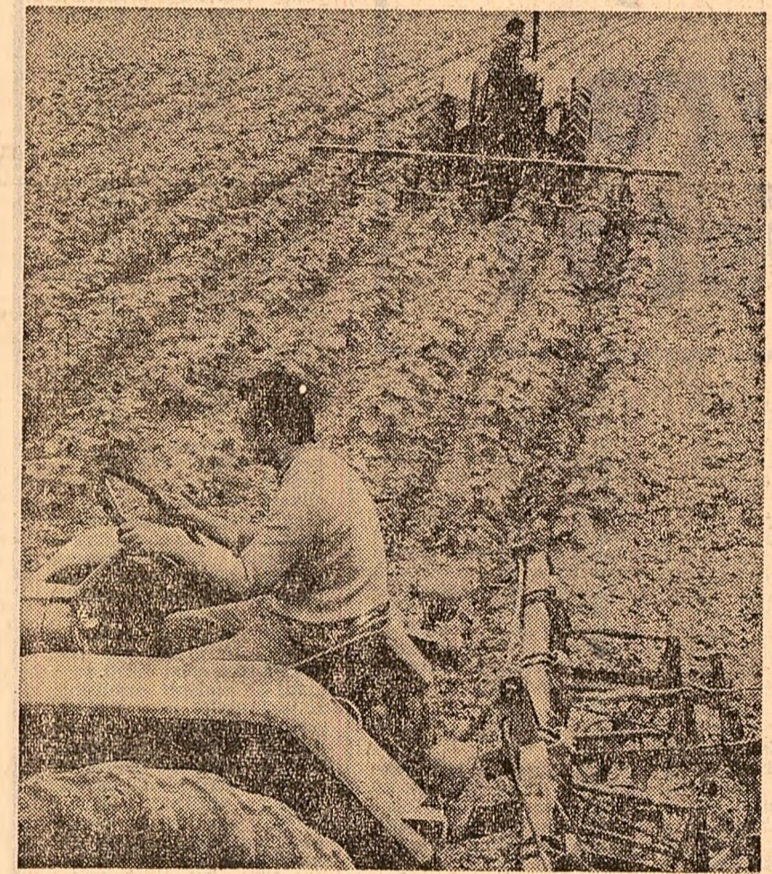
Lucrări de întreținere la floarea-soarelui executate mecanizat la cooperativa agricolă din Chertinș, județul Caraș-Severin

neficiari, problemele ce se ridică în legătură cu răspunderea materialelor a aslanților pentru produsele de proastă calitate. Cu ocazia consfăturii, la întreprinderile crăioveanu a fost organizată o demonstrație practică, „Ziua înalt calității a produselor”, în cadrul căreia 30 de controlori tehnici de calitate oaspeți au lucrat alături de tehnicienii întreprinderii, la examinarea calității produselor. La sfîrșitul schimbului de lucru au avut loc scurte discuții concluzive. (Agerpres)