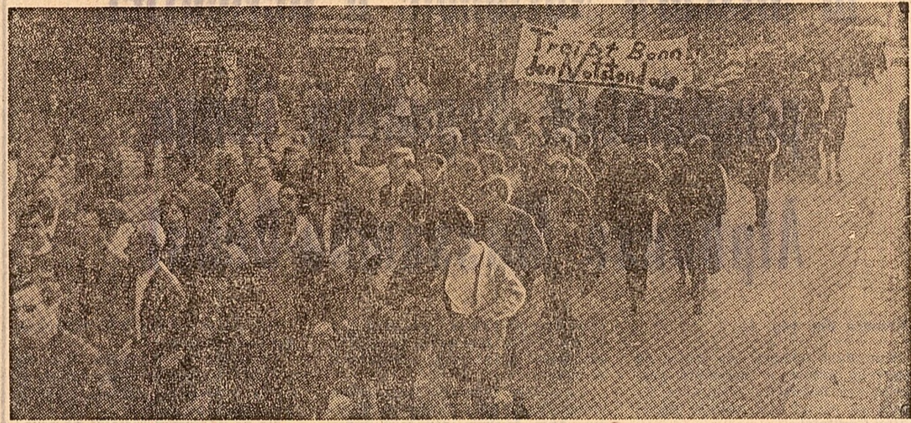
În Republica Federală a Germaniei conținut demonstrațiile pentru apărarea drepturilor democratice. În fotografie, un marș al populației din Hamburg

Partidul democrat-cristin s-a produs aceluși „clarificări” care la cel mai larg schimb de echipament și materiale nucleare. Dispozițiile în materie din tratat și din rezoluție, întărite prin declarațiile autorizate ale reprezentanților puterilor nucleare, se înscriu pe linia preocupărilor justificate ale țărilor nedezarmate de arme atomice de a putea beneficia din plin de potențialele civile ale energiei nucleare. Susținem părerea exprimată aici, a arătat vorbitorul, că viitoarea conferință a statelor nucleare îi revine un rol deosebit de important în găsirea celor mai potrivite modalități de aplicare practică a stipulațiilor din tratat privind accesul larg al acestor țări la progresele erei atomice. În încheierea cuvântării sale, Nicolae Ecobescu a spus: În acest spirit, în virtutea unei astfel de înțelegeri a principalelor prevederi ale tratatului, din împuneriunea guvernului Republicii Socialiste România, delegația română a votat în favoarea rezoluției. Votul reflectă dorința noastră neștrămutată de a se pune neîntârziat capăt cursei înarmării nucleare, de a se întreprinde noi pași concreți în direcția dezarmării. El exprimă speranța că acest important acord va fi urmat, fără întârzieri, de alte măsuri eficiente îndreptate spre lichidarea pericolului nuclear, către realizarea dezarmării generale.