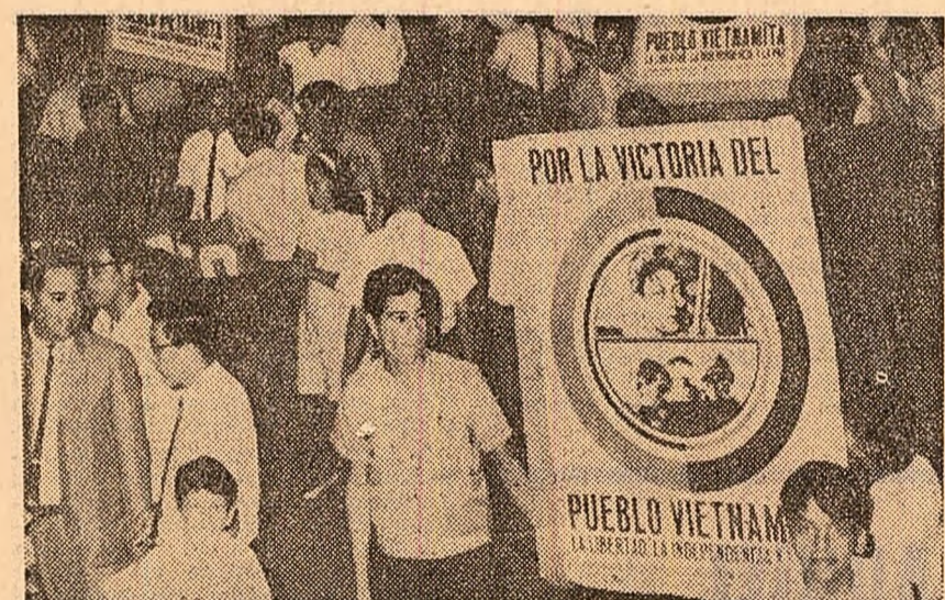
Locuitorii orașului ecuatorian Guayaquil, își manifestă solidaritatea cu lupta dreaptă a poporului vietnamez

SAIGON 13 (Agerpres). — Studenții Universității din Saigon au înaintat o declarație „guvernului” lui Tran Van Huong în care cere acestuia să găsească o „formulă realistă de pace” pentru a se pune capăt războiului din Vietnam pe calea tratativelor. În declarația semnată de Comitetul Central al Asociației studențești a universității se arată că războiul continuă din cauza „ambiciei imperialiste străine care impun din ce în ce mai multe suferințe și distrugerii Vietnamului”. „Cunoșcând nenorocirile pe care le aduce acest război de exterminare, văzând bombele și gloanțele care ne ucid compatrioții și distrug totul în jur, se spune în declarație, noi simțăm conștiența că războiul din Vietnam a ajuns la un punct în care trebuie să ia sfârșit pe calea tratativelor în așa fel încât populația să nu mai fie exterminată”.