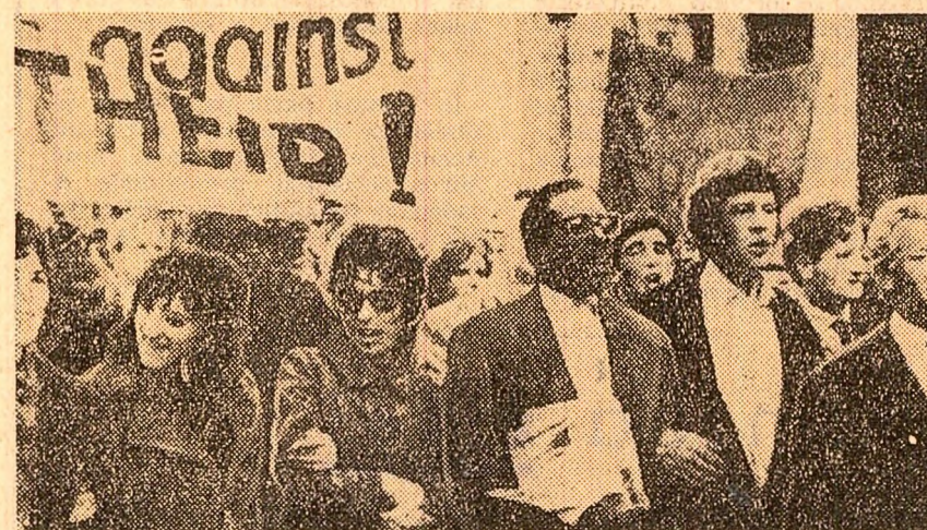
Londra. Demonstrație de protest împotriva politicii de apartheid din Republica Sud-Africană

A fost adoptată de asemenea o Declarație cu privire la situația din Vietnam. În declarație se cere guvernului S.U.A. să înceteze bombardamentele și alte acțiuni de război împotriva R. D. Vietnam.