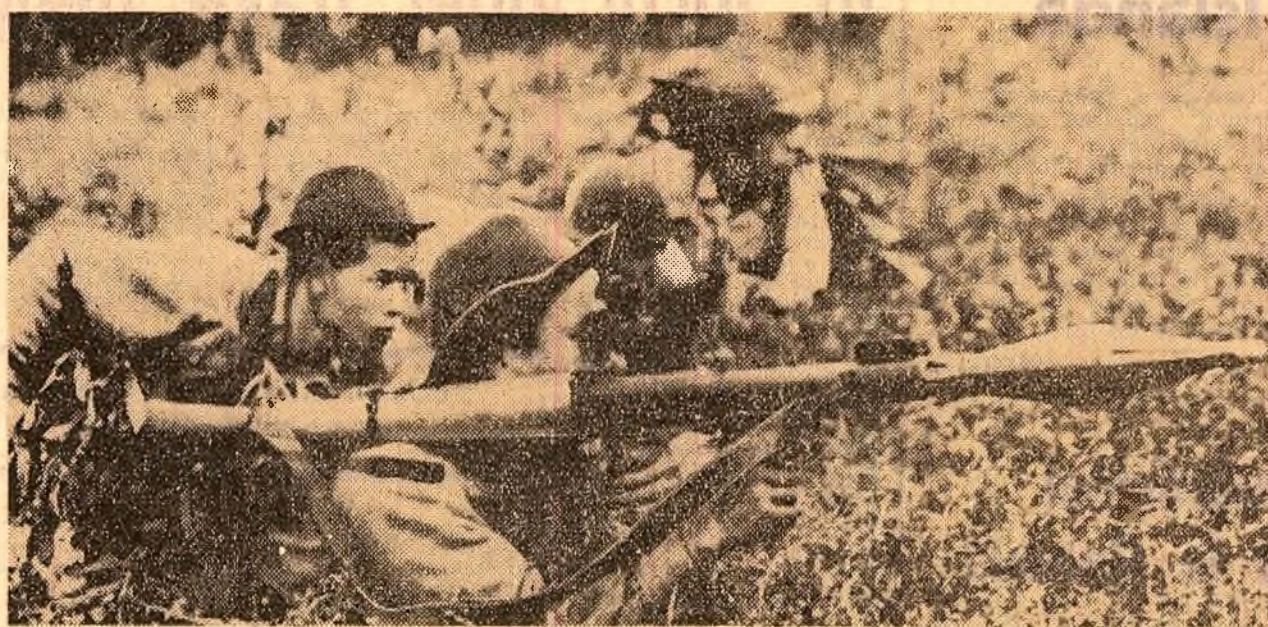
Un grup de patrioți sud-vietnamezi în plină acțiune de luptă

În intervenția sa, reprezentantul României, acad. Andrei Oțetea, și-a exprimat acordul cu orientarea generală a Proiectului de program și a activităților prioritare ale UNESCO în domeniul educației și științelor exacte și naturale. Vorbitorul a înfățișat însemnătatea programului de cooperare europeană și a subliniat necesitatea dezvoltării și diversificării lui. El a cerut totodată ca UNESCO să-și intensifice activitățile și în domeniul înțelegerii internaționale și al apărării păcii și să joace un rol tot mai activ în combaterea rasismului și a tuturor formelor de colonialism. Reprezentantul român a relevat, de asemenea, rolul sportului în prezent UNESCO în educarea tinerii generații în spiritul păcii, respectului reciproc și înțelegerii între popoare. Sprijinind prevederile bugetare ale Proiectului de program, acad. Andrei Oțetea a subliniat necesitatea ca UNESCO să ducă o politică de economii, sporind eficiența acțiunilor sale.