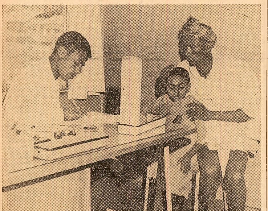
În Etiopia se desfășoară o largă campanie de prevenire și combatere a bolilor la copii. În fotografie: aspect dintr-o circumscripție sanitară din localitatea Dabat

diat în mod detaliat planul guvernului britanic în vederea relutării dialogului între cele două părți aflate în conflictul nigerian. Aceleași surse precizează că convorbirile dintre șefii statului nigerian și ministrul englez, desfășurate într-o atmosferă cordială, au înregistrat progrese. Pe de altă parte, șeful statului major al marinei nigeriene, contraamiralul Joseph Wey, a declarat într-o conferință de presă ținută la încheierea vizitei sale la Kampala că guvernul federal nigerian este dispus să reia în orice moment convorbirile cu reprezentanții Biaferei. După Uganda, șeful statului major al marinei nigeriene va vizita Etiopia și Kenya și îi va informa pe șefii acestor state asupra evoluției situației din Nigeria.