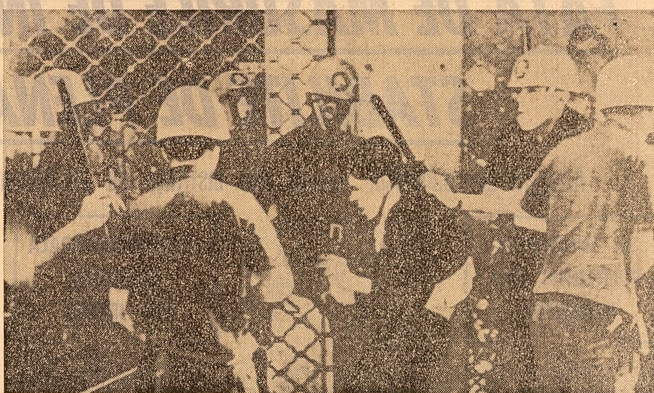
Rio de Janeiro este în aceste zile scena unor puternice manifestații studențești în sprijinul cererilor de majorare a fondurilor pentru necesitățile învățămîntului. Intervenția poliției s-a soldat cu moartea a patru persoane și cîteva zeci de răniți

Sîmbătă dimineața, oaspeții români au plecat, pe calea aerului, spre Florida, unde, la invitația Administrației naționale pentru aeronautică și cercetarea spațiului cosmic, vor vizita baza pentru lansarea de rachete spațiale de la Cape Kennedy.