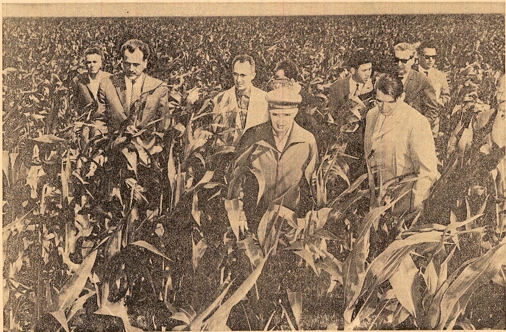
Pe locul fostelor bălți porumbul a dat în spic