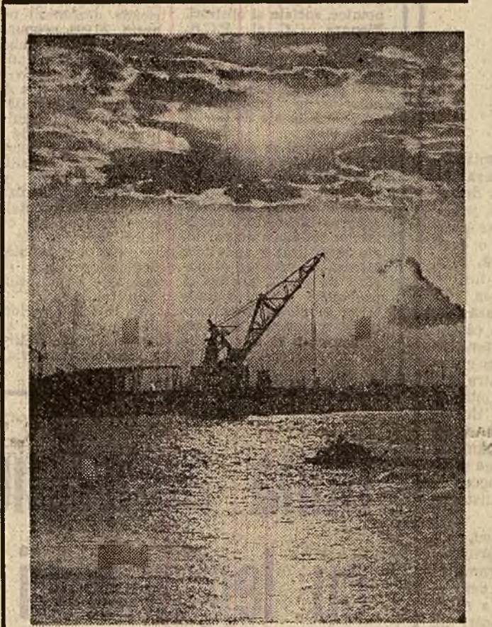
În omurg pe Dunăre