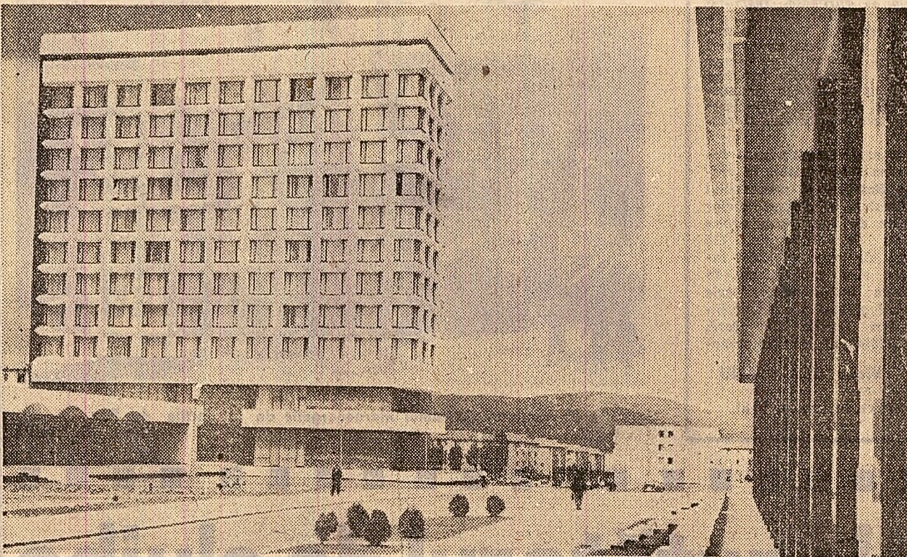
Noul hotel „Troțuș” din orașul Gh. Gheorghiu Dej — Județul Bacău

Arh. Gh. SASARMAN Manole CORCACI Nistor TILCU