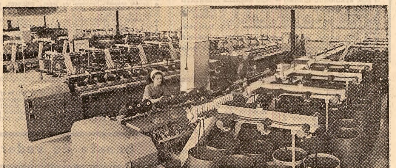
Întreprinderea textilă „Libertatea” Sibiu. În fotografie: aspect din noua secție de preparare.