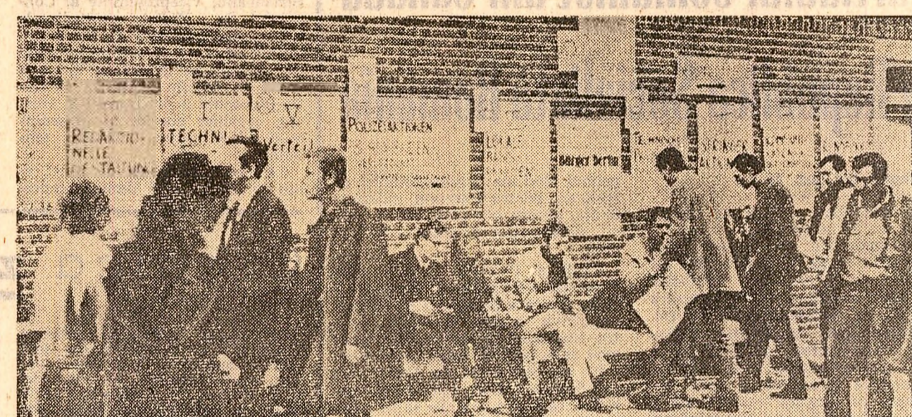
Afișe pe zidurile unor clădiri din Bonn împotriva războiului din Vietnam, a legilor excepționale adoptate de Bundestagul vest-german și pentru îmbunătățirea condițiilor de învățământ ale tineretului

Consiliul de Miniștri al Franței a hotărât ca alegerile pentru reînnoirea unei treimi a Senatului francez să aibă loc la 22 septembrie.