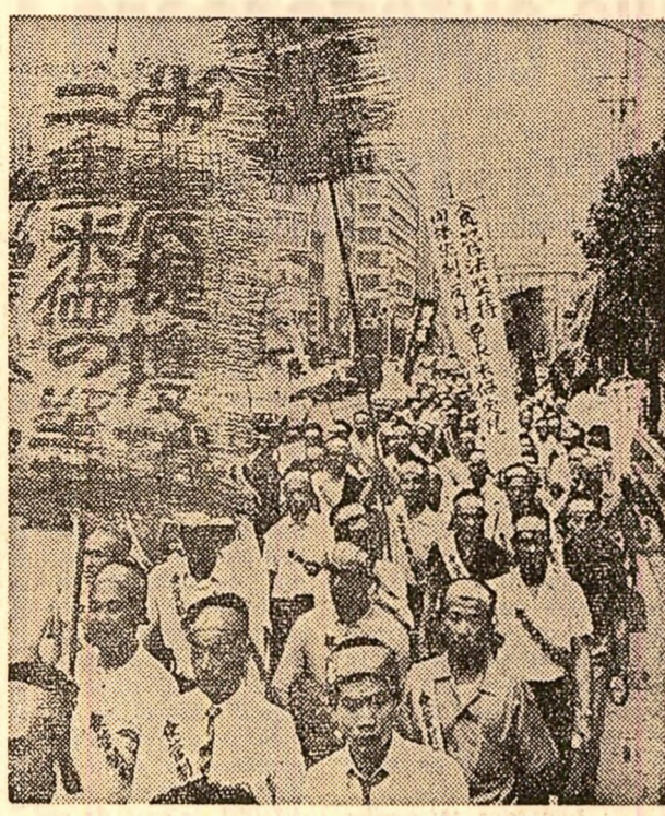
Tokio. Demonstrație a jăranilor japonezi împotriva politicii guvernamentale cu privire la problemele agrare

Sînt combătute îndeosebi cei ce-și fac iluzia că Statele Unite vor fi dispuse să-și ofere piața lor ca un fel de prelungire a pieței interne britanice. Intr-adevăr, viziunea proiectului N.A.F.T.A. subestimează dimensiunile protecționismului american. Cîne și-ar putea închipi, de pildă, că Washingtonul va înălțura bariera tarifelor, pentru ca piața americană să fie invadată de utilaje, mașini, automobile britanice? Dimpotrivă, se știe că de prohibiție este sistemul vamal al S.U.A., care aplică, de pildă, produselor chimice britanice taxe pînă la 172 la suta (1), iar whisky-ul scoțian, deși conține circa 57 la suta apă, este totuși impus ca alcool pur. Marile concurențe ale producătorilor S.U.A., îngrijorate de competiția străină, cer fixarea unor cote la importul de oțel, campanie în care se