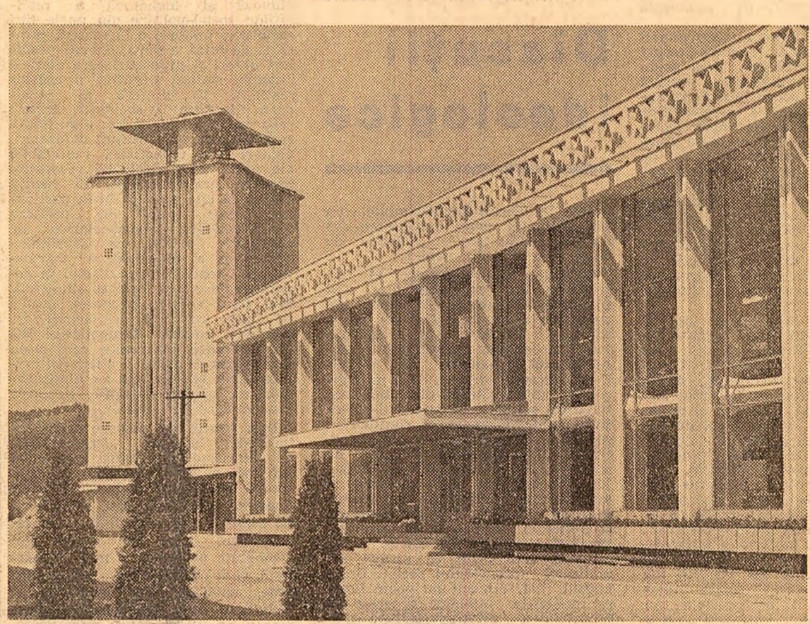
Clădirea noii gări din Orșova