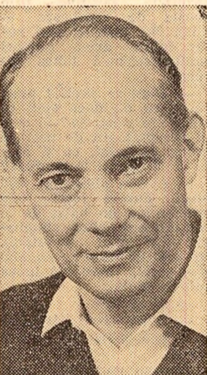
prof. dr. Manfred EIGEN laureat al Premiului Nobel — R.F. a Germaniei

Prof. dr. Manfred Eigen, originar din Bochum (R. F. a Germaniei) este în vîrstă de 41 de ani. El a studiat fizica și chimia la Göttingen (unde astăzi este el însuși profesor), obținînd, în anul 1951, titlul de doctor în științele naturii, specialitatea chimie fizică. În urma activității sale laborioase, prof. Eigen a fost distins cu numeroase premii și titluri onorifice, iar în anul 1967 i s-a acordat, pentru studiile sale asupra reacțiilor chimice foarte rapide, Premiul Nobel pentru chimie.