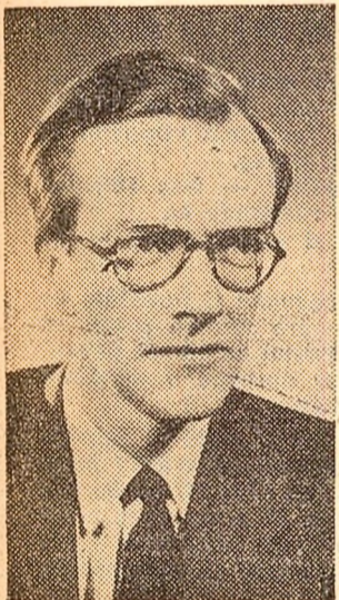
dr. Maurice H. F. WILKINS laureat al Premiului Nobel — Anglia

Maurice H. F. Wilkins, născut în Noua Zeelandă, astăzi în vîrstă de 52 de ani, după cercetări efectuate la universitățile din Scoția și Anglia, a colaborat în 1944, în Statele Unite, la „Manhattan Project”, lucrînd asupra separării izotopilor de uraniu. Cîrind a renunțat la investigațiile de fizică nucleară pentru a se concentra asupra problemelor de biologie moleculară și, în special, asupra structurii acidului desoxiribonucleic. În 1953, pe baza rezultatelor obținute de Wilkins prin difracția razei X, F. Crick și J. Watson au construit modelul acidului desoxiribonucleic, purtător al caracterelor ereditare, și au explicat funcționarea lui. Celor trei oameni de știință li s-a decernat, în 1962, Premiul Nobel pentru fiziologie și medicină.