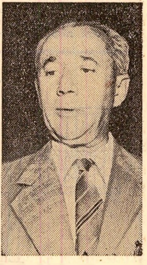
prof. Giulio NATTA laureat al Premiului Nobel — Italia

Profesorul Giulio Natta, binecunoscut specialist în domeniul chimiei macromoleculare și autor a circa 400 de lucrări, conduce Institutul de chimie industrială din Milano. O parte importantă a activității sale științifice a consacrat-o studiului structurii moleculare a polimerilor și obținerii unor lanțuri de polimeri cu structuri regulate, caracterizate prin prezența unor grupuri de molecule care le conferă unele proprietăți specifice, ca rezistența la temperaturi înalte. Aceste lucrări i-au adus, în 1963, Premiul Nobel.