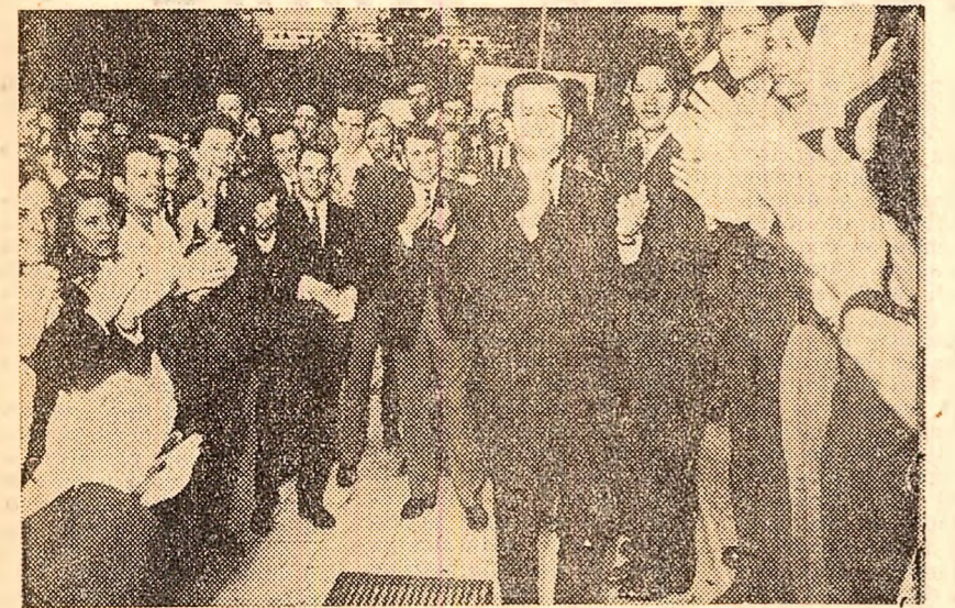
Întâlnirea delegației române cu solii poporului vietnamez

s-au întâlnit cu participanții la festival, au luat parte la mitinguri și la alte acțiuni de solidaritate cu lupta dreaptă a popoarelor lor. Cantonamentul unde se află delegația țării noastre a găzduit o adunare consacrată Laosului. Marți a avut loc deschiderea solemnă a concursurilor artistice internaționale — de canto, pian, vioară, instrumente populare, de muzică ușoară și jazz, de cintece și dansuri naționale. Seara, Teatrul național „Ivan Vazov” a găzduit concertul de gală dat de tinerii soliști ai țării românești. Concertul s-a bucurat de un deosebit succes.