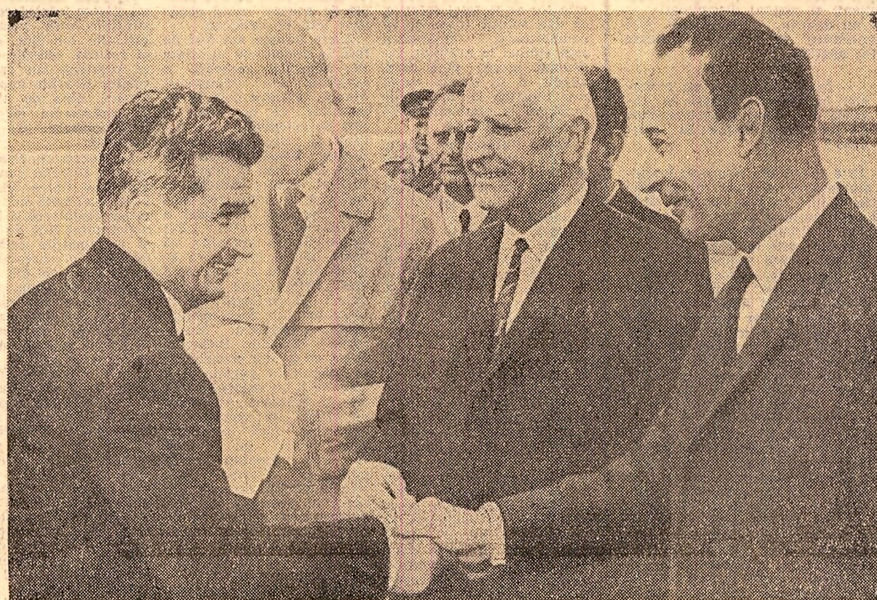
La sosire pe aeroportul din Praga