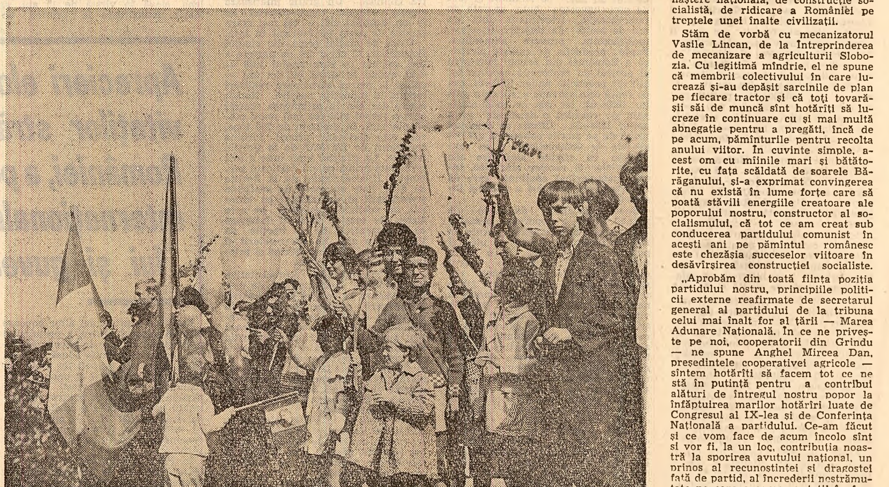
Turiști din Cehoslovacia în coloanele demonstrațiilor din Broșov