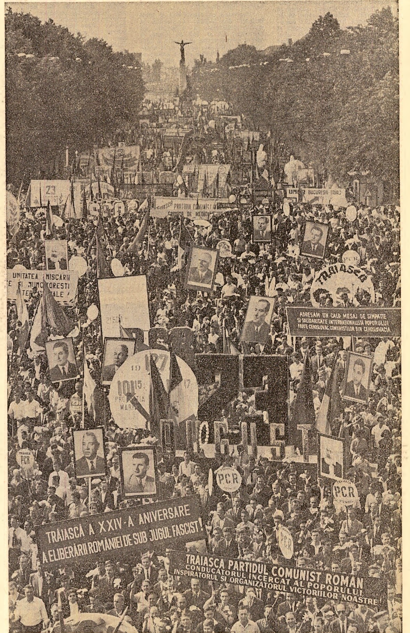
Fluviul uman al oamenilor muncii din Capitală, uriașă revărsare de dragoste pentru patrie și partid

— În această zi, ca și în fiecare an, marea sărbătoare se încheie cu tradiționala demonstrație a sportivilor. Sînt reprezentanții unui tineret vișoros, ai unei generații ferice, ale cărei trăsături esențiale sînt entuziasmul și energia, avîntul nestăvilit cu care a răspuns și răspunde la fiecare chemare a partidului.