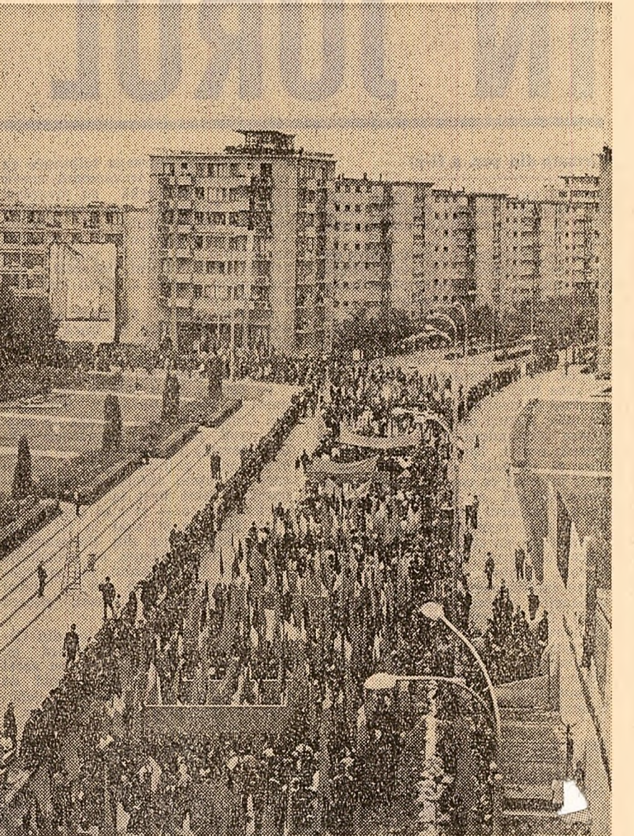
Siderurgiștii, constructori de nave, mii de alți oameni ai muncii din Galați au adus la demonstrație salba lor de succese

La Tg. Mureș, într-o atmosferă entuziasată, zeci de mii de oameni au participat la sărbătorirea zilei de 23 August, în fața tribunei defilărilor din Piața Ștefan cel Mare, țărani, intelectuali, tineri și vîrstnici, români, maghiari și germani, într-o deplină unitate. Ei prezintă la cîntecul marilor noastre sărbători naționale, muncitorii din țară, înțelegînd și înțelegîndu-se, ferm angajați într-o activitate creatoare de ridicare pe o treaptă superioară a patriei noastre socialiste. Cu toți sînt animai de aceeași hotărîre fermă de a lupta neabătut pentru realizarea politicii partidului, politica ce chezură și noi succese pe drumul socialismului, afirmarea plină și înflorirea forțelor de creație ale națiunii noastre. Aici, pe malul Mureșului, au fost construite însemnate obiective industriale în cartierul Mureșeni a luat ființă o nouă zonă industrială, cu întreprinderi constructoare de mașini, ale industriei chimice, de prelucrat piel, unități ale industriei alimentare etc. În coloanele demonstrațiilor i-am întâlnit pe chimistii combinatului de îngrășăminte azotoase „Jocari” al noului cartier industrial. Recent, într-o telegramă adresată C.C. al P.C.R., tovarășul Nicolae Ceaușescu, el au raportat terminarea etapei a II-a de dezvoltare a combinatului. Noile capacități asigură triplarea producției de azot de amoniu a combinatului. Prin îngrășămintele chimice produse la Tg. Mureș se contribuie la creșterea vi-