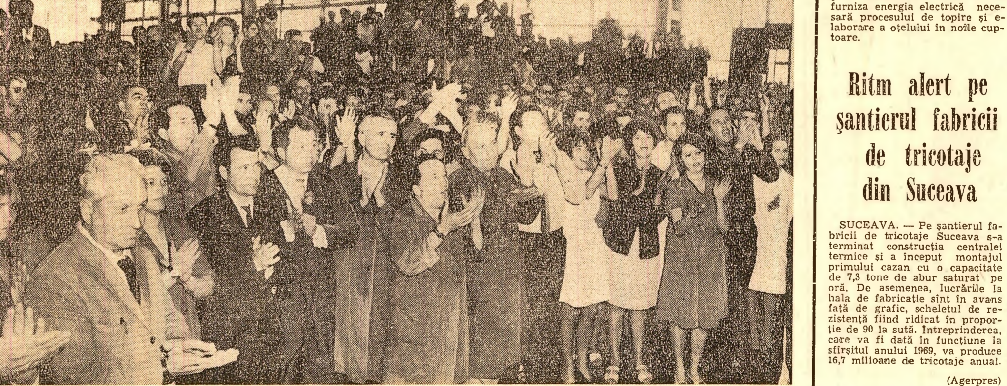
În timpul mingiiului de la Fabrica de mașini-unelte și agregate din Capitală

În încheiere, tovarășul Paul Niculescu-Mizil a adresat cele mai bune urări de succes în activitatea colectivului fabricii, activitate pusă în slujba marii cauze a înfloririi României socialiste.