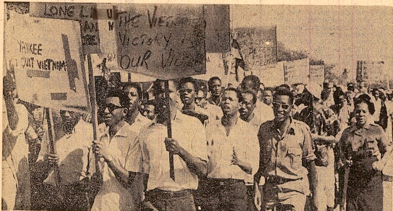
Tanzania. Demonstrație de solidaritate a studenților din Dar es Salaam cu lupta dreaptă a poporului vietnamez