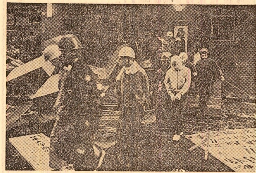
La Universitatea Nihon din Japonia, aproximativ 2500 de studenți au ocupat localul universității, cerînd satisfacerea revendicărilor lor cu privire la democratizarea învățămîntului. În timpul violențelor ciocniri care au avut loc între studenți și polițiști, au fost arestați 123 de studenți.