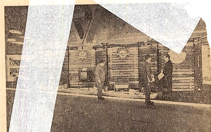
Grupul de studii al Institutului românesc la recentul Tîrg internațional de produse tehnice de la Sidney (Australia)

Primul ministru al Republicii Trinidad-Tobago, Eric Williams, a anunțat cu prilejul celui de-al 11-lea Congres al partidului țării, că guvernul țării a hotărît să naționalizeze instalațiile locale ale societății „British Petroleum Ltd.” și să cumpere acțiunile acestor de radio și televiziune controlate în prezent de magnatul preselandic, lordul Thomson.