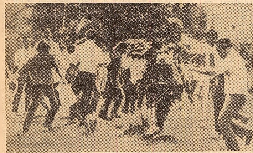
Măsurile adoptate de Filipine în problema teritoriului Sabah au stîrnit puternice demonstrații de protest în capitala Malayeziei

în cinstea lui Franz Jonas. Cei doi șefi de stat au rostit toasturi. Întreaga presă iugoslavă acordă o importanță deosebită vizitei președintelui Austriei. Subliniind interesul celor două țări în menținerea și apărarea păcii în Europa și în lume, ziarul „Borba” menționează că relațiile dintre Iugoslavia și Austria s-au dezvoltat continuu. Anul trecut, schimbul de mărfuri a atins cifra de 107 milioane dolari de ambele părți, față de numai 34 milioane în 1960. Se intensifică, totodată, schimbările culturale și tehnico-științifice.