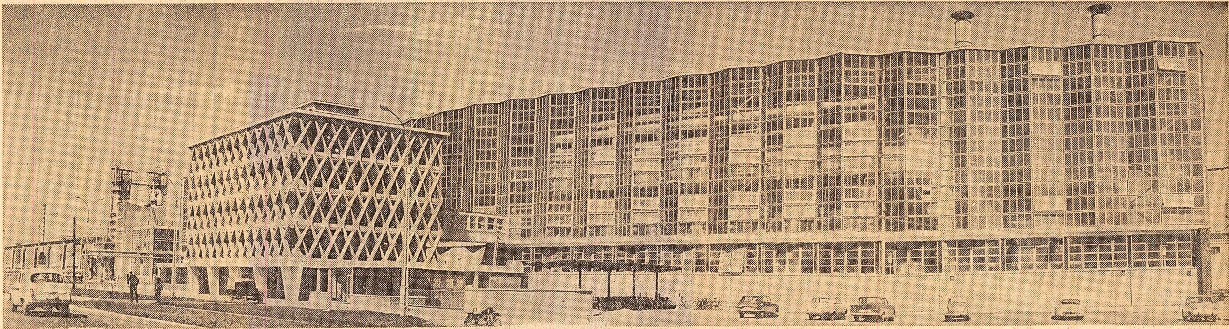
Vedere exterioră a noii fabrici de zahăr din Buzău a cărei capacitate (în final) de prelucrare în 24 de ore va ajunge la 3.000 tone sfeclă de zahăr