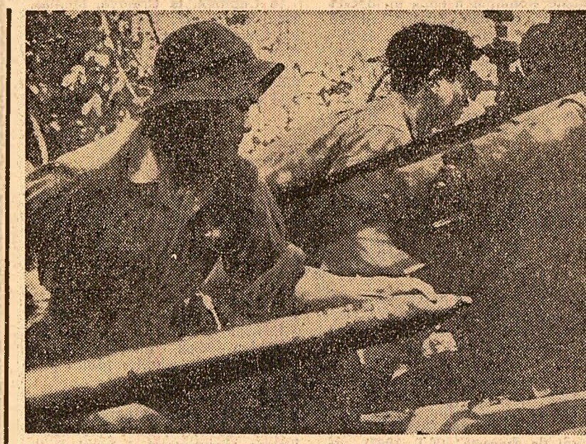
O unitate de artilerie a forțelor patriotice sud-vietnameze în acțiune

Procedîndu-se la un schimb de păreri în legătură cu situația internațională actuală, s-a constatat în multe probleme a punctelor de vedere. Cele două părți au căutat de acord că menținerea păcii în lume este sarcina primordială a tuturor popoarelor. Relațiile dintre toate statele trebuie să se întemeieze pe respectarea independenței, suveranității și integrității teritoriale. Subliniind rolul O.N.U., cei doi președinți și-au exprimat convingerea că pentru problemele politice rezolvate pot fi găsite soluții trainice numai prin respectarea consecventă a telurilor și principiilor cuprinse în Carta O.N.U. Ei au relevat necesitatea depunerii în continuare de eforturi comune în scopul rezolvării problemelor internaționale pe cale pașnică.