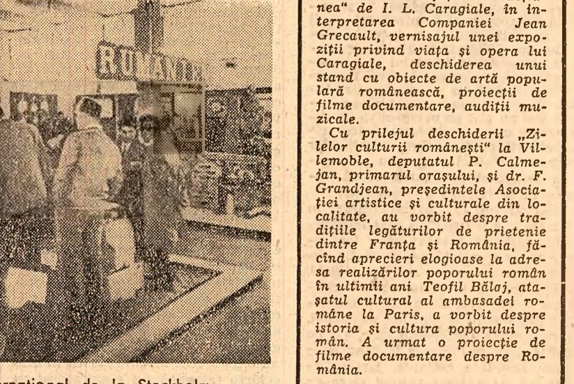
Standul colaborarea la Tîrgul internațional de la Stockholm