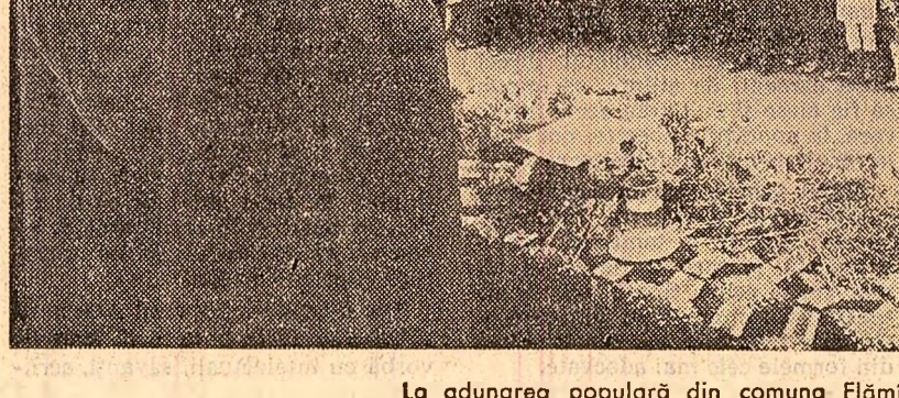
La adunarea populară din comuna Flămînzii

Vă doresc la toți mîna sănătațe, o viață tot mai îmbelșugată și fericită. (aplauze, urale puternice, prelungite).