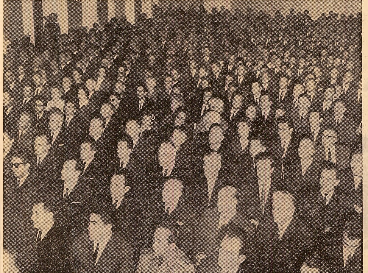
În timpul întîlnirii cu intelectualitatea ieșeană

În sala Filarmonicii de Stat „Moldova”, unul dintre cele mai prestigioase lăcășuri de cultură ale Iașului, au fost de față, într-o reprezentativă participare a tuturor generațiilor și domeniilor de activitate intelectuală, numeroși oameni de știință, de literă și de artă din vestică cetate universitară. Ei au fost cu vibranta primire conducătorilor de partid și de stat, întîmpinîndu-i de la intrare cu puternice aplauze, expresie a dragostei și atașamentului fierbinte al întregii noastre intelectualități față de partid.