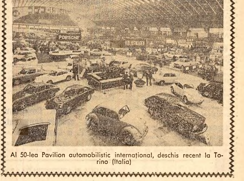
Al 50-lea Pavilion automobilistic internațional, deschis recent la Torino (Italia)

Tradiționala „Lună a preparatelor culinare”, în plină desfășurare, constituie un prilej de afirmare a talentului și priceperii bucătarilor și cofetarilor. În toate unitățile alimentației publice bucătării prezintă „specialitatea unității” și „specialitatea zilei” în condiții îmbietoare. Sînt oferite consumatorilor preparate specifice bucătăriei românești, în special cele caracteristice sezonului de toamnă și iarnă. Se pot procura din unitățile specializate semipreparate de tip „Gospodina”. Există, de asemenea, posibilitatea de a se livra diverse produse și la domiciliu.