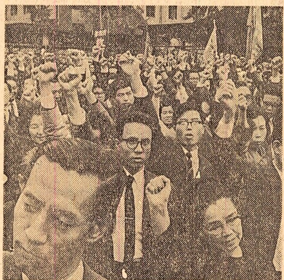
TOKIO. Imagine de la o recentă acțiune revendicativă organizată de oamenii muncii din capitala japoneză în cadrul „ofensivei de toamnă”

Mao Tze-dun, președintele C.C. al P.C. Chinez, a primit la 10 noiembrie pe generalul Agha Mohammad Yahia Khan, comandant șef al armatei pakistaneze, care se află la Pekin în fruntea unei delegații militare. Cu această ocazie a avut loc o convorbire prietenească, la care au fost de față Ciu En-lai, premierul Consiliului de Stat al R. P. Chineze, și alte persoane oficiale. (Agenția China Nouă).