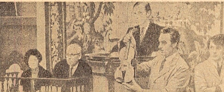
În localitatea engleză Sotheby a avut loc o licitație în care o vioră Stradivarius a fost vîndută pentru suma de 52.800 dolari — prețul cel mai mare plătit pînă acum pentru un asemenea instrument muzical

Reprezentantul la O.N.U. al Zambiei, Vernon Mwaanga, a adresat Consiliului de Securitate o scrisoare, în care acuză Portugalia pentru comiterea „unui act flagrant de agresiune militară” împotriva țării sale. Scrisoarea precizează că, la 6 noiembrie, trupe portugheze au ocupat poziții în satul Kameta din districtul Katete, în apropierea frontierei cu Mozambicul.