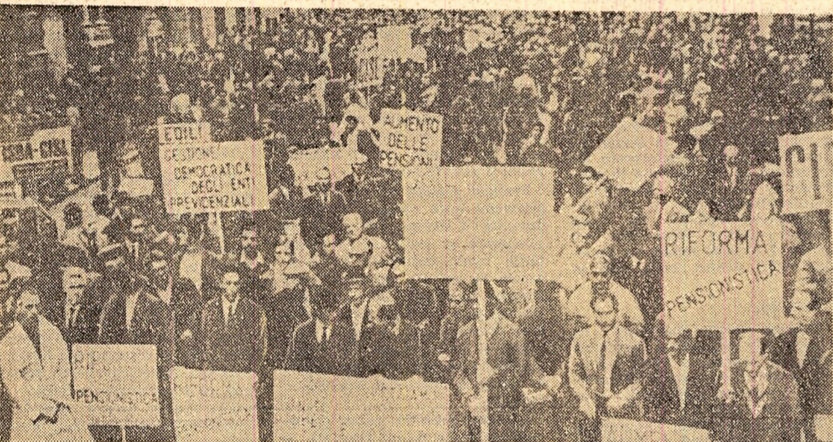
Aspect de la mitingul organizat la Roma

La 13-lea Festival Internațional al filmului pentru copii de la Teheran, filmul „Năică pleacă la București” a obținut premiul special al Ministerului Educației iranian (diplomă și statueta de aur). Premiul a fost înmănat de împărăteasa Farah.