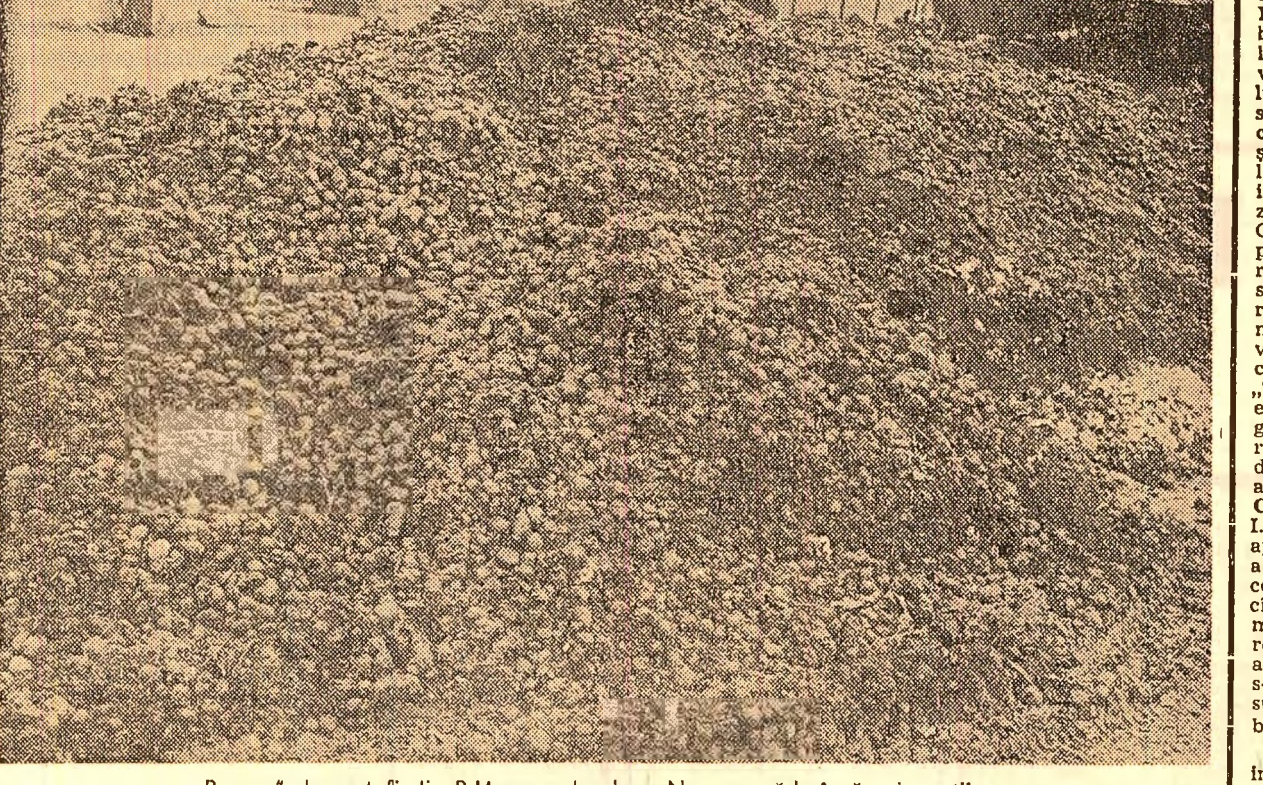
„Rampa” de cartofi din B.M. se vede clar. Nu se văd încă vinovății...