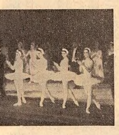
Ansamblul de balet al Operei române din București în sala Operei ungare de stat din Budapesta, spectacolul inaugural al turneului pe care îl întreprinde în R. P. Ungară. Baletul „Lacul lebedelor”, prezentat de artiștii români, s-a bucurat de un deosebit succes. Spectatorii budapeșteni și-au exprimat sentimentele de căldură și înaltă prețuire pentru măiestria artistică a balerinilor români, aplaudând îndelung.