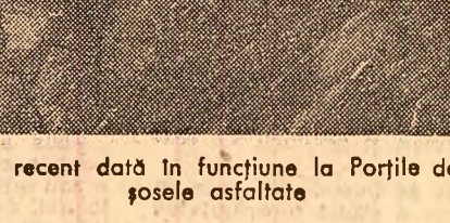
Alături de noua linie de cale ferată, recent dată în funcțiune la Porțile de Fier, se conturează profilul viitoarei șosele asfaltate

și nici de plăcere. Cele mai multe dintre termene l-au fost cerute ferm de către beneficiar și de împrejurările deosebite care impun intrarea în funcțiune la 31 decembrie a.c. a fabricii de pline. Situația de ultim moment, care s-a creat la aceste două obiective, aduce din nou în atenție optica care domină încă activitatea multor constructori. Crezul lor a rămas atacarea priorității, chiar și împotriva oricărei logici tehnologice. A lucrărilor mari, de valori ridicate, care înlesnesc îndeplinirea relativ ușoară a planului, execuția lucrărilor mici și de mijloc. Ioan ERHAN