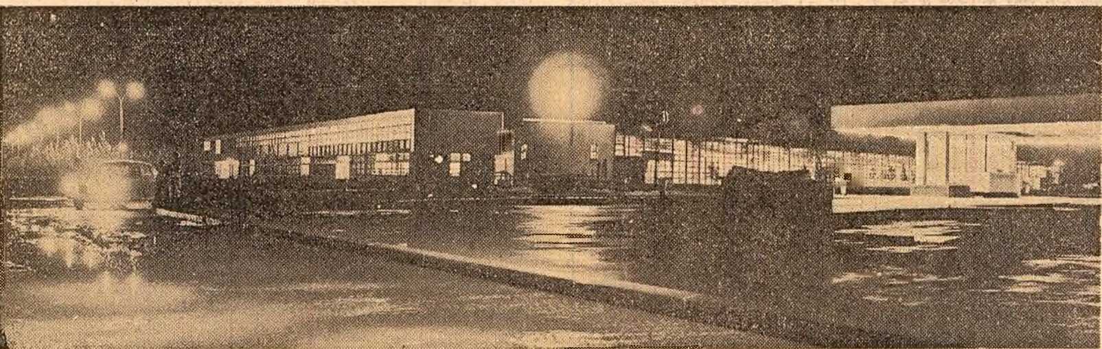
Zona industrială a orașului Buzău