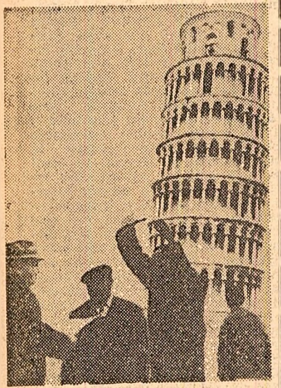
Faimosul turn înclinat din Pisa va mai puțin rezista unui ușor cutremur — este concluzia la care a ajuns o echipă de specialiști în urma unui amănunțit examen al celebrului monument