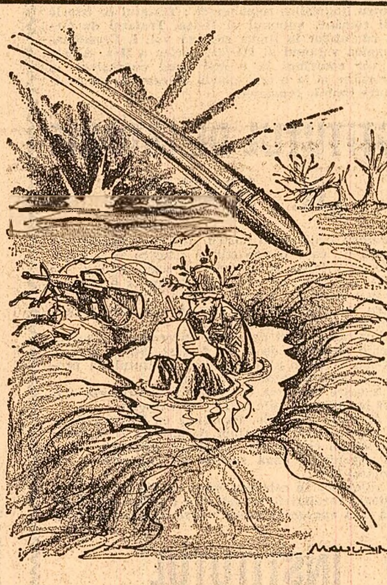
Soldatul american în Vietnamul de sud: Generale Ky, în să-și comunică cu un soldat din Vietnamul de sud (Generalul Ky, în să-și comunică cu un soldat din Vietnamul de sud)

PRAGA 8 (Agerpres). — În cadrul primei sesiuni a Consiliului Național Ceh, care s-a deschis la 8 ianuarie la Praga, Prezidiul consiliului a desemnat guvernul Republicii Socialiste Ceh. Președintele al guvernului a fost numit Stanislav Razl, iar Antonin Cervinka și Ladislav Adamec — vicepreședinți.