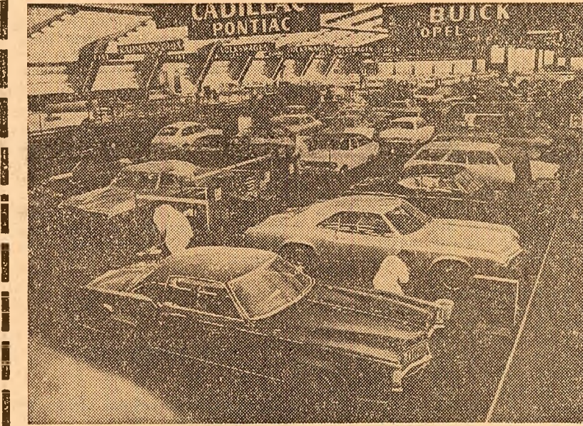
Vedere generală a „Salonului automobilului“ deschis la Bruxelles. Participă 284 de firme din 14 țări

La Sanaa, capitala R. A. Yemen, situația a devenit încordată și nesigură, amenințînd să degeneze într-un război civil, scrie corespondentul agenției Reuter. Cauza tulburărilor ar fi, după agenția citată, ciocnirile dintre partizanii primului ministru Hassan al Amry și cei ai fostului șef de stat maroc, Abdul Raheeb Whahab. În legătură cu aceasta, se menționează că în timpul luptelor trei dintre susținătorii lui Raheeb și 12 soldați guvernamentali ar fi fost uciși.