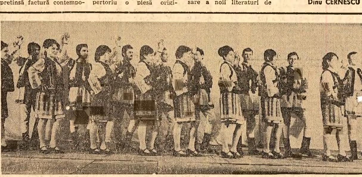
Formația de dansuri populare a Casei de cultură a sindicatelor din Piatra Neamț