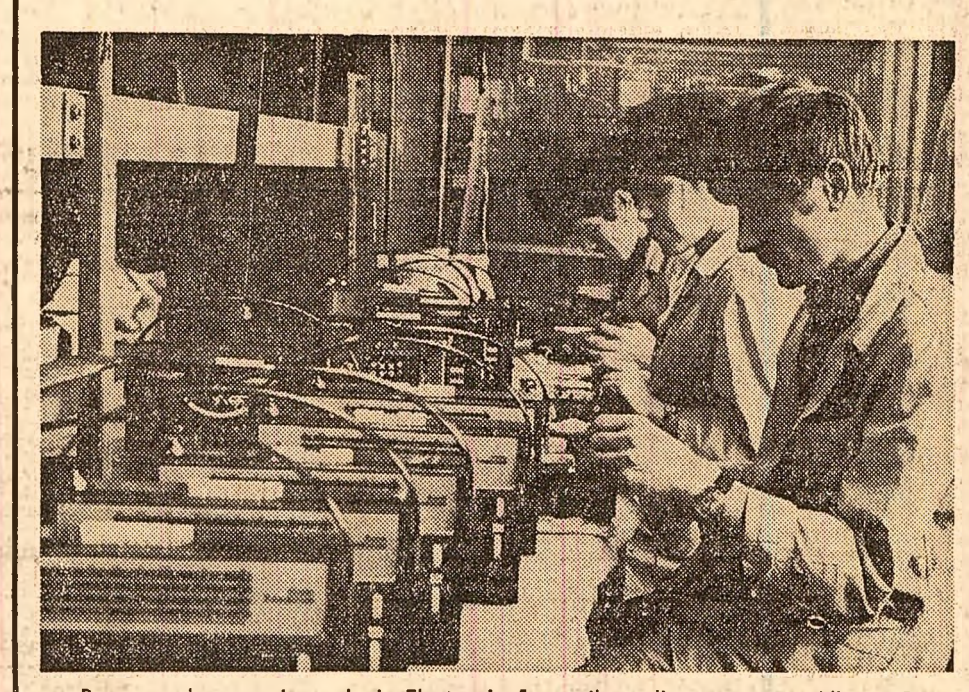
Pe masa de montaj a uzinei „Electronica”: noile radioreceptoare „Albatros”

În urma anulării unei comenzi de produse lactate, la întreprinderea „Industria lăptărie” Timișoara a rămas, încă din 1968, 35.000 bidioane din tablă de 5 kg fiecare. Bidoanele au sosit fără documente, nu s-au înregistrat și nimeni nu le are, de atunci, în gestiune. Bidoanele în condiții de depozitare în numărul total necesar răspundătoare, ceea ce a făcut ca circa 15 000 din ele să se degradeze complet.