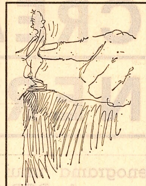
Ajutor „prietenesc”. Desen de Ion POPESCU-GOPO