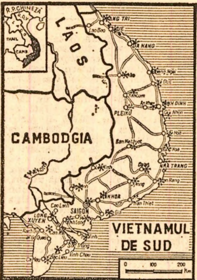
Localitățile însemnate cu asteriscuri reprezintă regiunile în care se desfășoară acțiunile ofensive ale forțelor patriotice sud-vietnameze.

● ATACURI CU RACHETE ASUPRA SAIGONULUI ● PLANURI AMERICANO-SAIGONEZE DE REPLIERE ÎN JURUL MARILOR LOCALITĂȚI