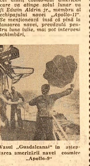
Vasul „Guadaluca” în așteptarea amerizării navei cosmice „Apollo-9”

Pînă la încheierea zborului de zece zile, cei trei cosmonauți vor mai executa anumite exerciții de navigație, vor continua fotografierea unor regiuni ale Pământului și vor pregăti coborîrea pentru amerizare. La centrul spațial de la Houston s-a anunțat marți că